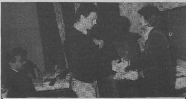
Večje število mladih je bilo na ta dan sprejetih v zvezo komunistov. Posnetek je z gimnazije Moste, kjer so se vrste komunistov povečale za devet članov.