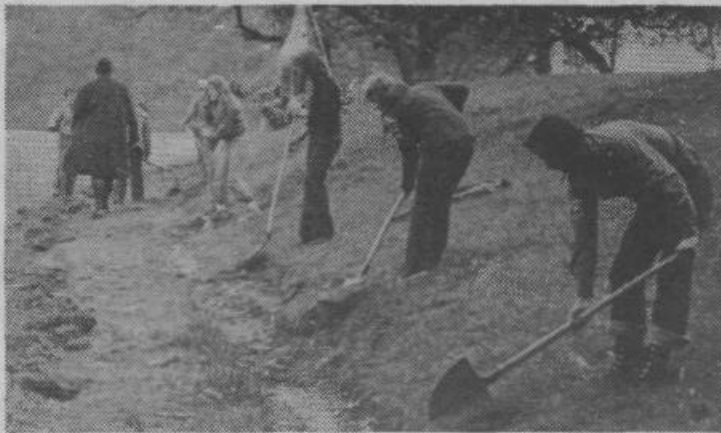
Številne zabavne prireditve, športni turnirji, delovne akcije so potekale ob dnevu mladosti. V SAP — Viator so mladinci pripravili razstavo, posvečeno tovarišu Titu, v OŠ Polje je bilo 3. srečanje mladih tehnikov Ljubljane in nekaterih krajevnih skupnosti pa so se mladi pomerili v več športnih panogah. Prav na dan mladosti so brigadirji naših prvih dveh brigad KRAS in ISTRA delali na delovišču Poti spominov in tovarištva.