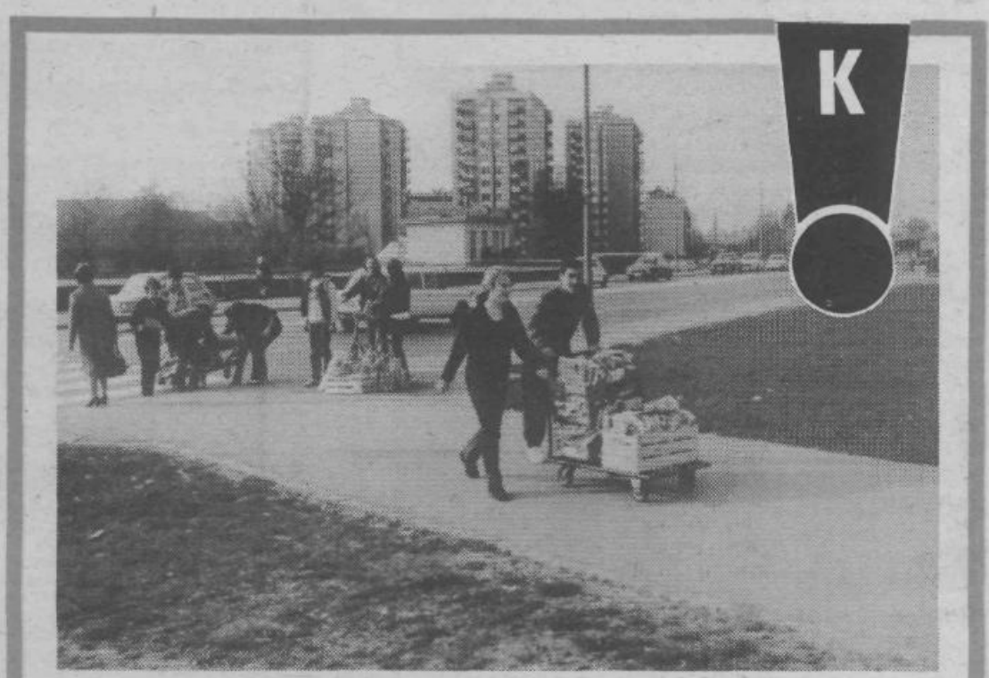
Pionirji in mladinci Štepanjskega naselja redno zbirajo star papir. Največkrat je to humanitarna akcija za Rdeči križ. V tem primeru pa so mladinci zavijali rokave in zbirali star papir za končni izlet. Tudi prav in obojestransko koristno.

Časopis prejemajo vse družine v občini brezplačno na domove.