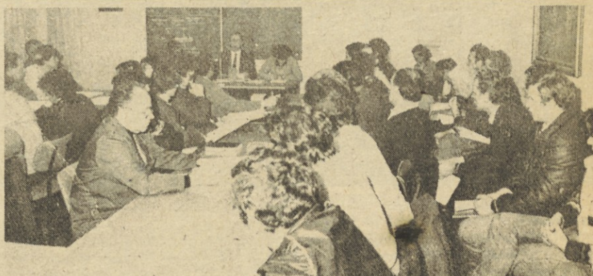
TOZD Elektromotorji, Železniki — Pred samoupravnim potrjevanjem ciljev letošnjega gospodarskega načrta Tovarne elektromotorjev in gospodinskih aparatov iz Železnikov so se o vsebini najpomembnejšega letošnjega samoupravnega akta pogovarjali tudi strokovni, poslovodni in najodgovornejši družbenopolitični in samoupravni delavci temeljne organizacije. Letošnje zahtevne naloge pri dvigovanju produktivnosti dela in za petino večjem izvozu ob celo nekaj nižjem uvozu kot lansko leto bodo terjale vključevanje in veliko delovno disciplino vseh Iskrašev iz Železnikov. Na množičnem sestanku, ki je bil 13. januarja izven delovnega časa, so ocenili, da je plan realnejši kot lanski, da pa je velika ovira nepoznavanje letošnjih gospodarskih razmer. Tako še vedno niso znane možnosti razpolaganja z devizami za financiranje proizvodnje in za uspešnejšo, manjkrat prekinjeno oskrbo s surovinami in reprodukcijskimi materiali.

To je pravzaprav zaupanje prizadevanjem Iskre v zadnjih letih pri osvajanju proizvodnje, zagotavljanju kvalitete in uveljavljanju novih izdelkov. To zaupanje nas postavlja tudi v zahteven položaj, saj se zavedamo odgovornosti, ki iz tega izvira: V teh težkih pogojih