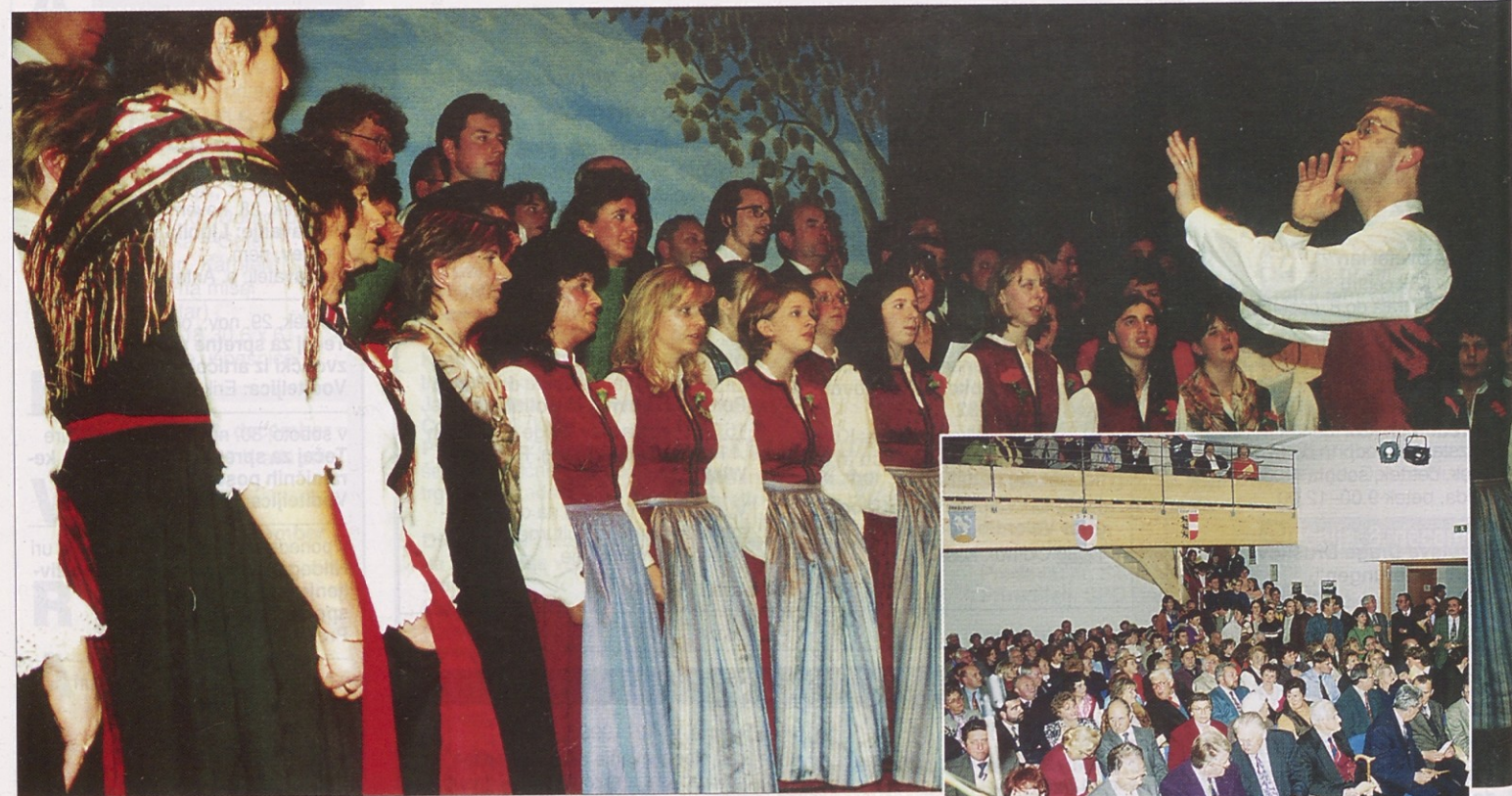
Vsi nastopajoči zbori (velika slika) so se ob koncu združili ter zapeli pesem „Nmav čez jizaro“. Dvorana v kulturnem domu (desno) je bila nabito polna.

Dobrla vas – slavnostna prireditev ob jubileju SPD „Srce“ in MePZ „Srce“