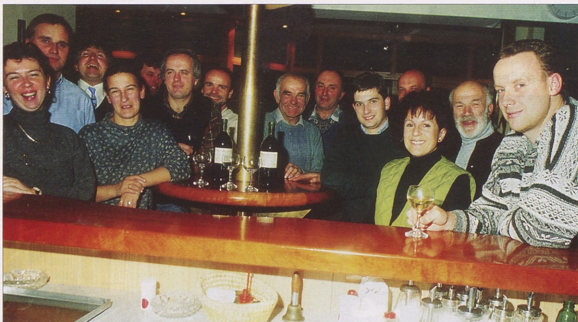
V Tinjah so se preteklo sredo srečali kandidati, volilni pomočniki in zaupniki SJK in so razpravljali o tem, po kateri poti naj gre SJK v prihodnje. Takih srečanj in posvetov bo odslej več, SJK pa bo dobila svojo lastno pisarno, ki bo poldnevno zasedena.