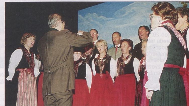
Prvi nastop v kulturnem domu – Singgemeinschaft Eberndorf.