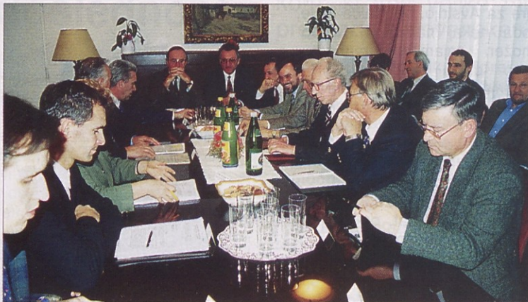
Občinski mandatarji in župani obmejnih občin so v Celovcu razpravljali o izboljšanju medobčinskega sodelovanja.

V okviru EU Interreg programov so se odprle občinam nove možnosti sodelovanja, ki pa jih na žalost zdavnaj ne koristijo optimalno. Tako so letos ostali vsi Interreg projekti v predalu, denar, ki ga je EU namenila Koroški in Sloveniji, pa bo verjetno šel na Štajersko, kjer sodelovanje med obmejnimi občani bolje teče. V pogovoru, v katerem so avstrijsko koroške občine zastopali župani in po en zastopnik EL, sta obe strani zagotavljali, da je potrebno sodelovanje izboljšati. Konkretno bo