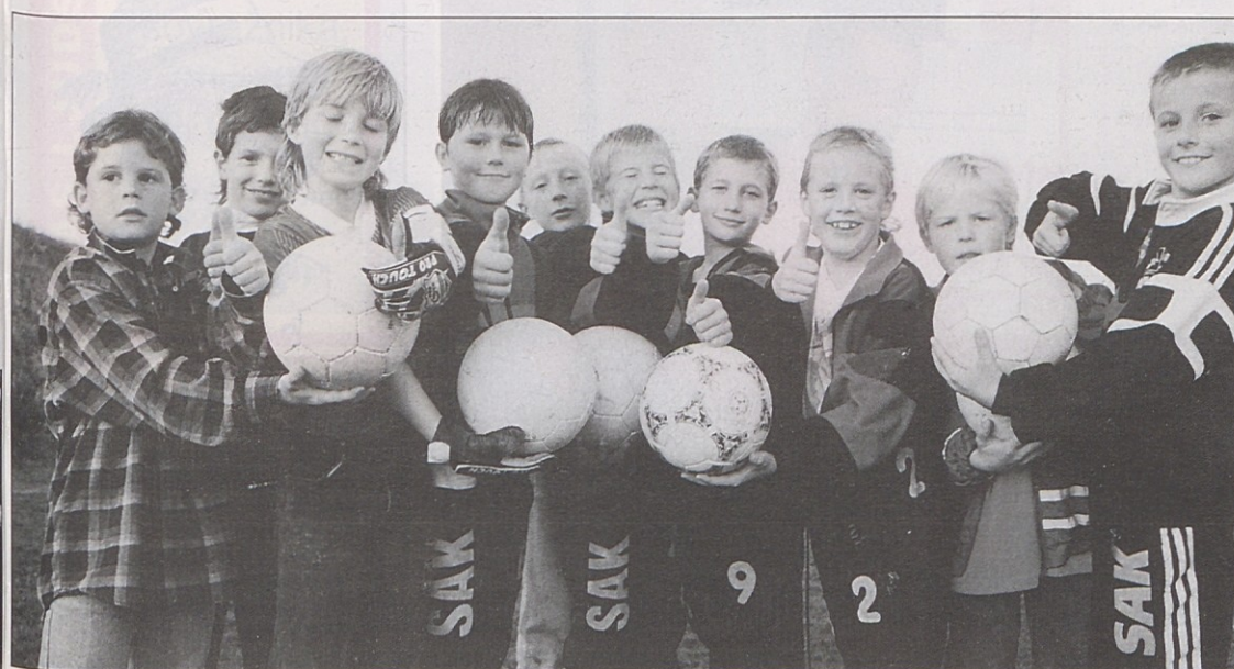
En, dva, SAK, ... mi smo najboljši na Koroškem.