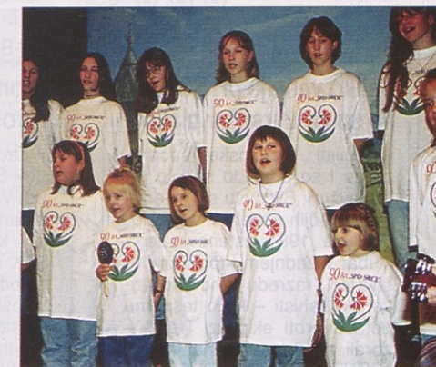
Otroški zbor „Srce“