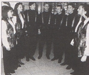
Skupina Vox bo v Vogrčah pela za akcijo „Luč v temo“.

Vogrče. V soboto, 30. novembra, bodo ob 19.30 v Vogrčah pri Florijanu nastopali domači zbori za akcijo „Luč v temo“. Nastopali bodo ansambel VOX, Die Buben, Woschitz Buam, Mlada Podjuna, Kärntner Express in ljudska šola Vogrče.