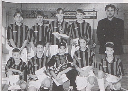
SAK U 14 iz Pliberka je v finalu premagal SV Spittal s 6:0.