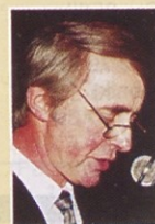
Ustanovitelji bi bili srečni, ko bi videli razvoj društva.