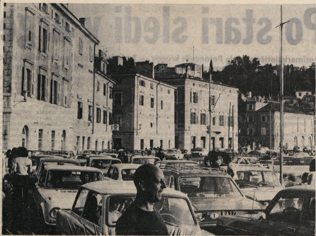
PIRAN SE KOPA V PLOČEVINI — Mestni očetje zato vse pogosteje razmišlja, kako bi pred mestom zgradili parkirišče za vse in vsaj v poletnih mesecih prepovedali vožnjo po pretesnih piranskih ulicah.