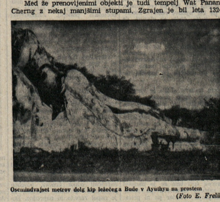
Osemindvajset metrov dolg kip ležečega Bude v Ayuthyu na prostem