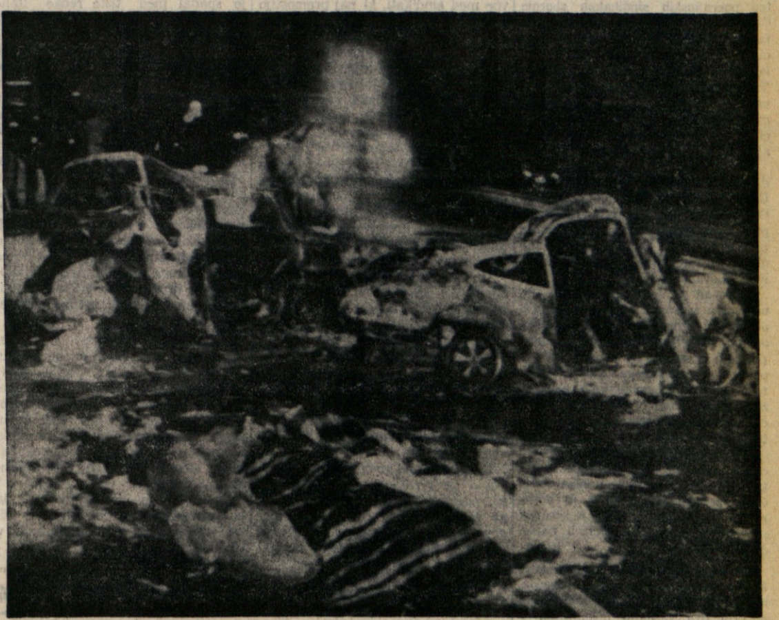
Včeraj se je začel «veliki povratek» s počitnic. Danes in jutri bo po italijanskih cestah krožilo nad 15 milijonov avtomobilov, ki se bodo vračali na delovna mesta. Velik promet, nepravilnost in prevelika hitrost sta bili vzrok številnih nesreč, v katerih je izšlo življenje najmanj sedem ljudi. Na sliki prvor prometne nesreče pri Chiavariju, v kateri je v četrtki pozno zvečer izšlo življenje osem ljudi, dve osebi pa sta bili hudo ranjeni. Poročilo o položaju na italijanskih cestah berite na osmi strani