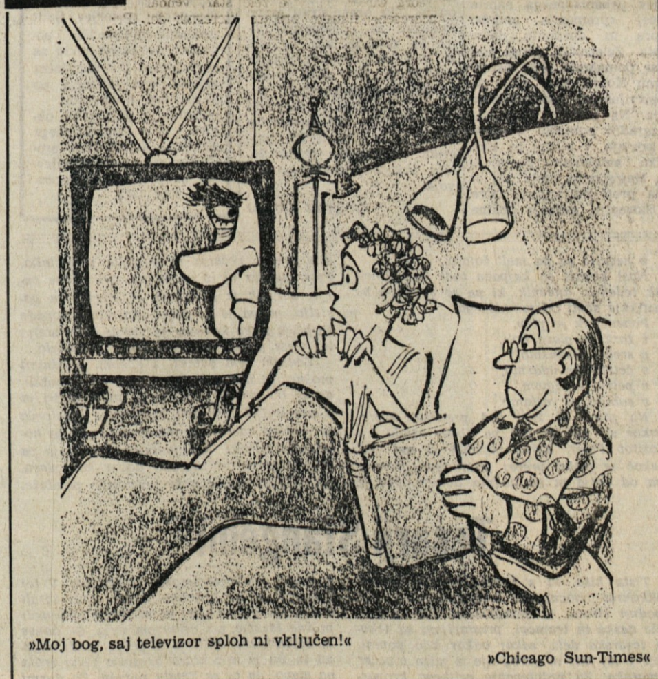
»Moj bog, saj televizor sploh ni vključen!« »Chicago Sun-Times«