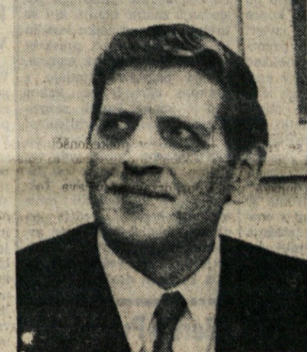
Dr. Anton Vratuša

Po drugi strani pa države v razvoju zaradi dosedanjih prizadevanj v razvoju