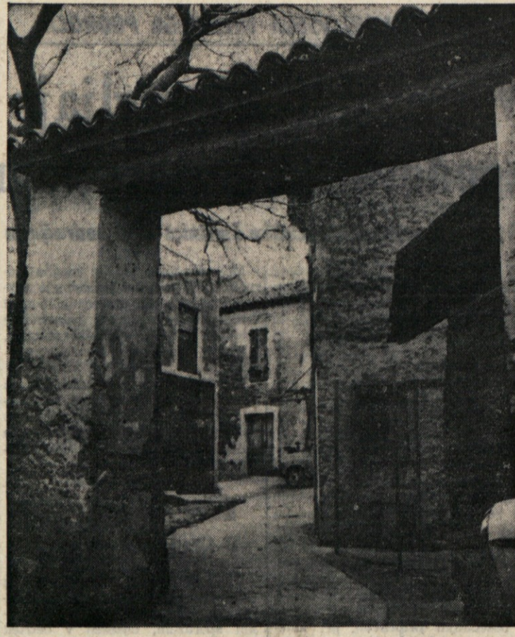
Kraški motivi