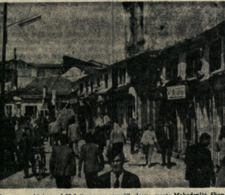
Po potresu, ki je pred 10 leti povsem porušil glavno mesto Makedonije, Skopje, je nastalo povsem novo mesto. Vendar se je ohranilo tudi nekaj starega