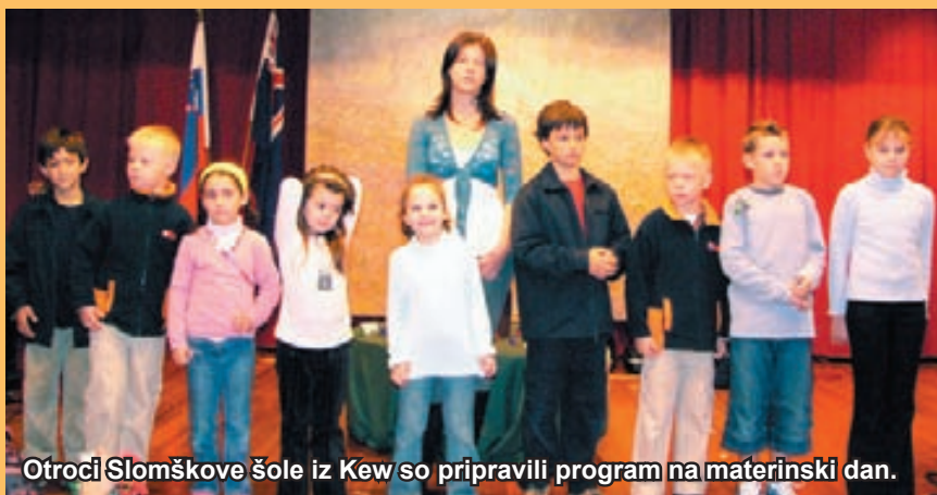
Otroci Slomškove šole iz Kew so pripravili program na materinski dan.