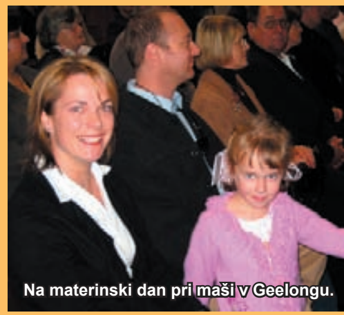
Na materinski dan pri maši v Geelongu.