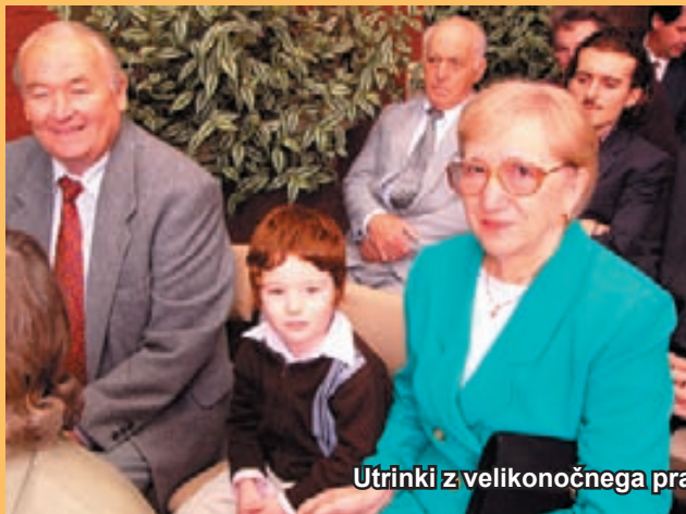
Utrinki z velikonočnega praznovanja v Kew.