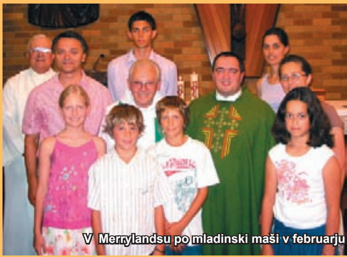
V Merrylandsu po mladinski maši v februarju in otroci Slomškove šole za materinski dan.