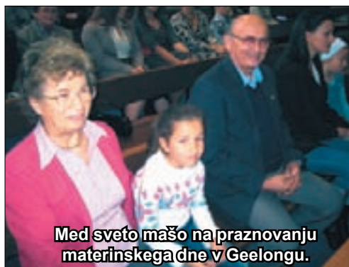
Med sveto mašo na praznovanju materinskega dne v Geelongu.