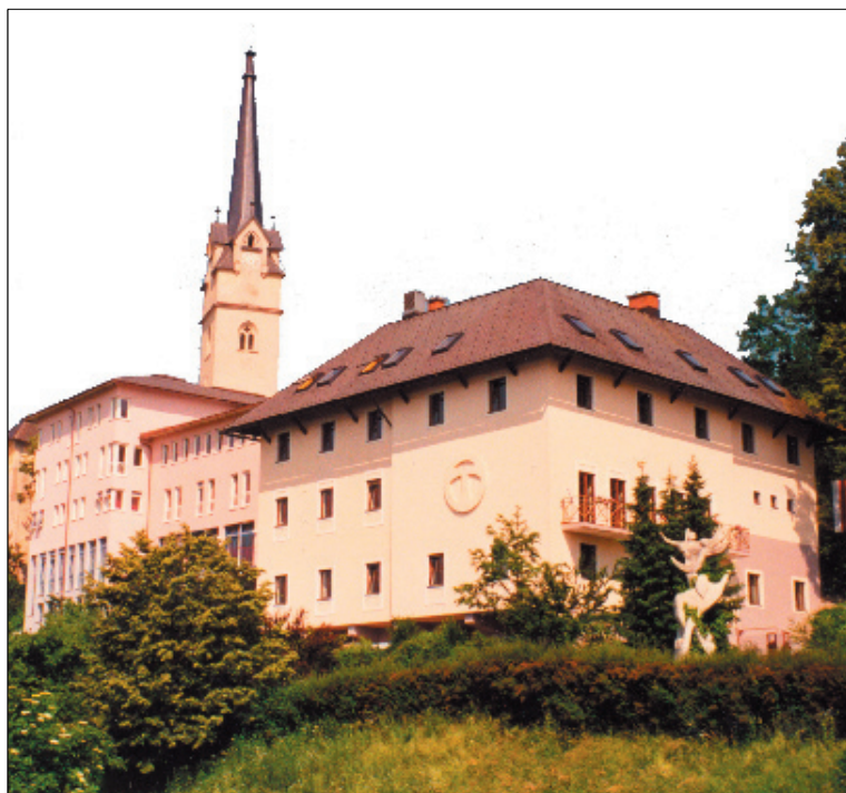
Dom Sodalitas v Tinjah z župnijsko cerkvijo v ozadju.

Najbolj so urejene cerkvene strukture, ker imamo svoje zastopstvo v slovenskem pastoralnem svetu, slovenski škofljani pa smo zastopani tudi v vseh škofijskih