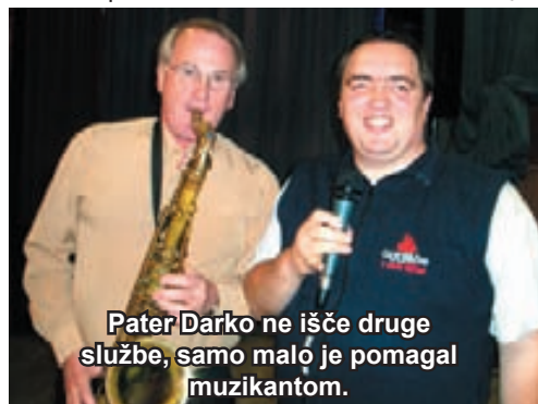
Pater Darko ne išče druge službe, samo malo je pomagal muzikantom.

Revija Moja Slovenija je gratis – brezplačna, financira in podarja jo Urad Vlade Republike