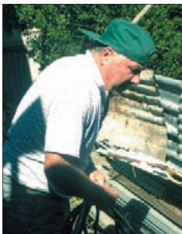
Akcija čiščenja okolice cerkve.