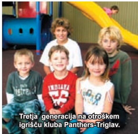
Tretja generacija na otroškem igrišču kluba Panthers-Triglav.