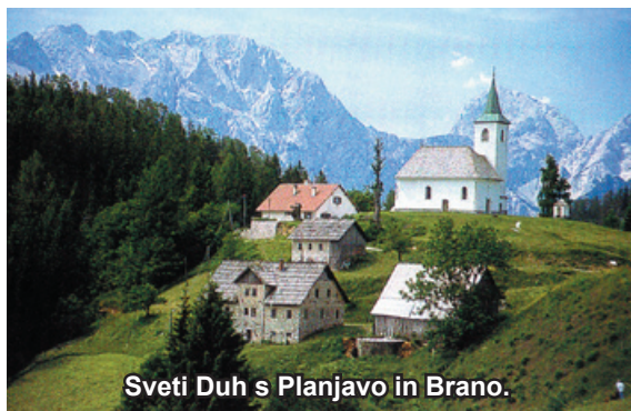
Sveti Duh s Planjavo in Brano.

Željo Slovencev po samostojni državi sva zaslutila že leta 1989. Z možem sva bila ravno takrat na dopustu v domovini. Najin dom je sicer Avstralija. Domovino sva zapustila zelo mlada, jaz kot 13-letno dekle, mož kot 19-leten fant. Kljub mladosti sva ohranila močno slovensko kulturo in ljubezen do domovine. Sva dolgoletna in aktivna člana najstarejšega Slovenskega društva Melbourne, ki deluje že 52 let.