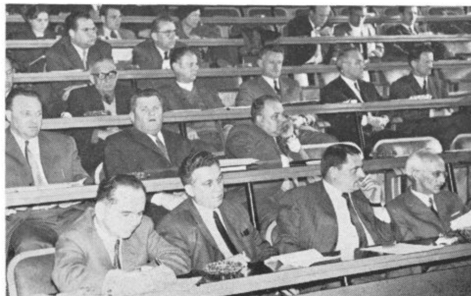
Clani in gosti na drugi konferenci občinske konference ZKS

Program te velike prireditve je zdaj naslednji: poleg zbora aktivistov OF v Dolenjskih Toplicah 7. junija ob 11. uri, bo popoldne ob 15. uri otvoritev muzejsko urejene Baze 20 na Kočevskem Rogu. Tja vabijo vse udeležence topliške proslave. Priznanja OF ne bodo podelili v Dolenjskih Toplicah, ampak v Ljubljani 25. aprila.