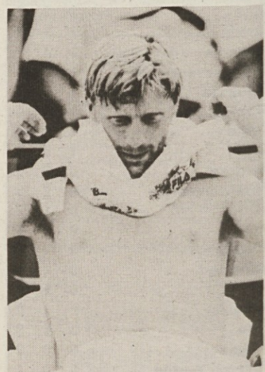
V teniškem turnirju je prišlo do velikega presenečenja, saj je izpadel eden glavnih favoritorov, Nmec Boris Becker