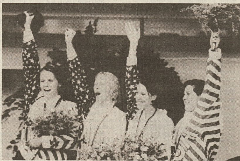
Ameriške štafetistke so na 400 m mešano s časom 4:02,54 dosegle nov svetovni rekord, a reprezentanca ZDA v Barceloni ni zadovoljila

Pravi fenomen so Rusi: ko je vse kazalo, da bodo politične spremembe v njihovi nekdanji skupni domovini močno osiromašile njihov šport, je Rusom uspelo doseči svoje najboljše rezultate sploh. Razlog je verjetno v tem, ker so se znali pravčasno vključiti v moderne "business" tokove in so na primer njihovi najboljši plavalci celo zimo prežive-