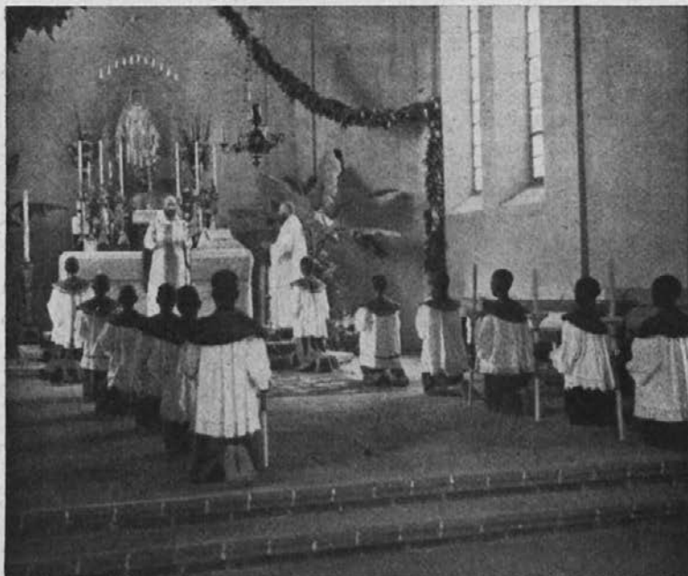
Zamorski semenišniki obljublajo zvestobo Jezusu.