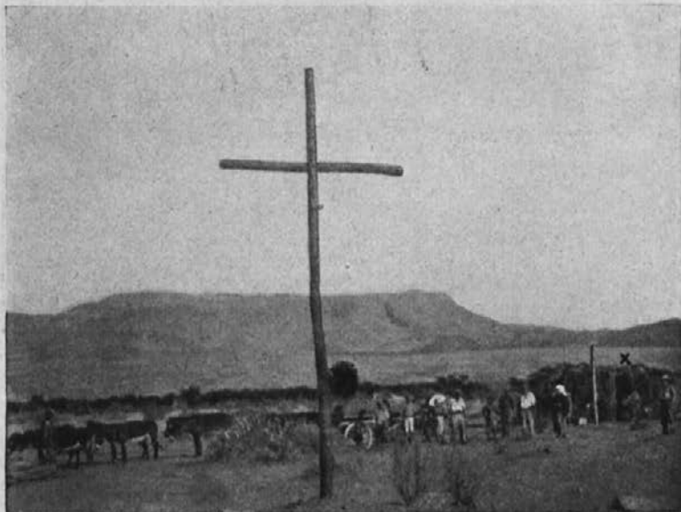
Novo ustanovljeni misijon v Houms River.

Šole so prenapolnjene. To opravičuje, da ima misijon vedno večji vpliv med mohamedanskim ljudstvom. Napredujemo, počasi sicer, a vztrajno. Pri nas je šolski obisk prost; nihče nikogar ne sili v šolo. In vendar starši otroke radi k nam pošiljajo, da se uče krščanskega nauka. Radi sprejemajo zlasti tiste npravne resnice, ki so obče človeške.