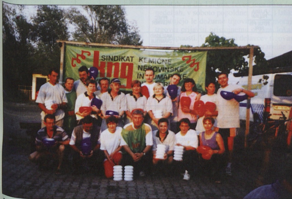
Najboljši so prejeli pokale Steklarne Luminos iz Slovenske Bistrice.