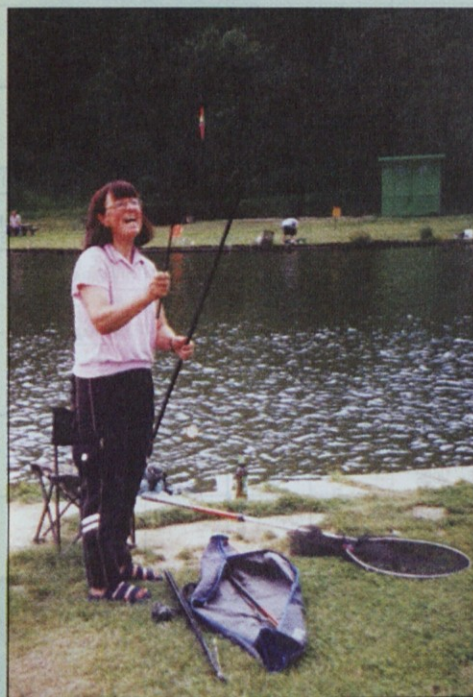
Za ribolov so se tekmovalke in tekmovalci temeljito pripravili, na kar je kazala tudi njihova oprema.