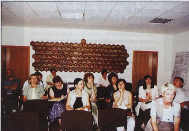
Seja republiškega odbora je bila v Čebelarskem centru Slovenije na Brdu pri Lukovici.

ZSSS je pred časom pripravila predlog spremembe zakona o dohodnini, po katerem bi bile odpravnine odpuščenih delavcev proste davčnih obveznosti. Ker predlagatelj tega predloga niso hoteli sprejeti, je ZSSS predlagala