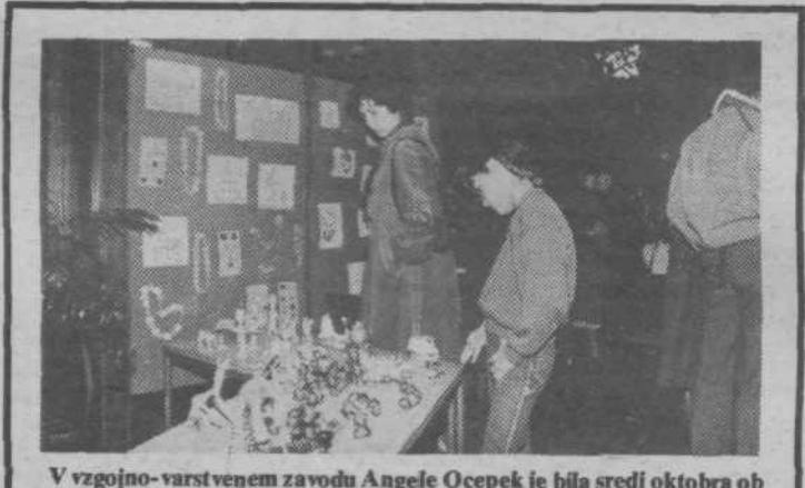
V vzgojno-varstvenem zavodu Angele Ocepke je bila sredi oktobra ob 20. obletnici smrti Angele Ocepke in 15. obletnici obstoja zavoda spominna slovesnost. Ob tej priliki je bila v vrstu tudi razstava otroških izdelkov. D. J.