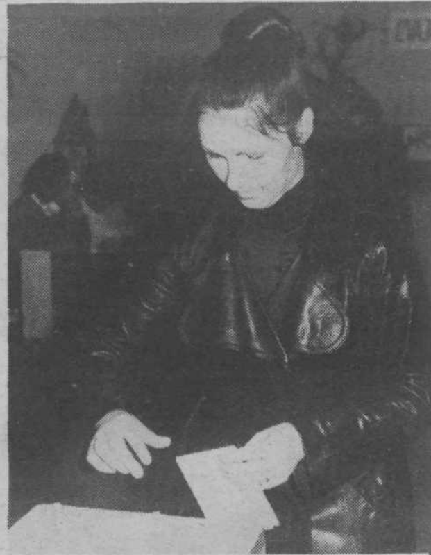
9. novembra — volitve delegatov v novih krajevnih skupnostih