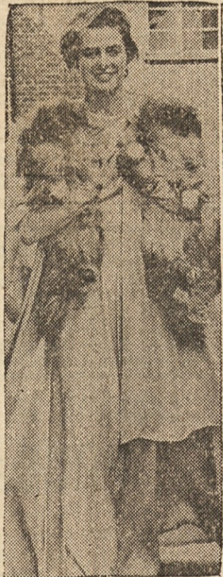
PASJA DRAŽBA — Ingrid Bergman nastopa v svojem novem filmu "Rumeni Rolls-Royce" s psi. Na sliki jo vidimo v njihovi družbi.

"Kateriga leta je bil princ Abi rojen? Istega, kakor ti, si rekel?" je vprašala TUA z očitnim namenom, starega in