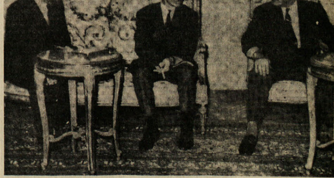
Predsednik ZAR Naser (desno), alžirski predsednik Bumedien (na sredi) in jordanski kralj Husein na posvetovanju v Kairu

Uslužbenici italijanskega Rdečega križa so proglasili 24-urno stavko, ki bo 15. julija. Danes se je pričela 48-urna stavka uslužbencev pilotov v zvezi z zahtevami o obnovitvi delovne pogodbe.