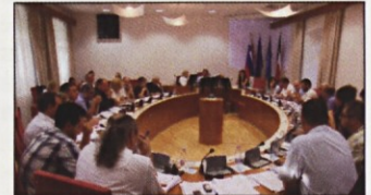
Občinski svetniki so sejali do poznih večernih ur.