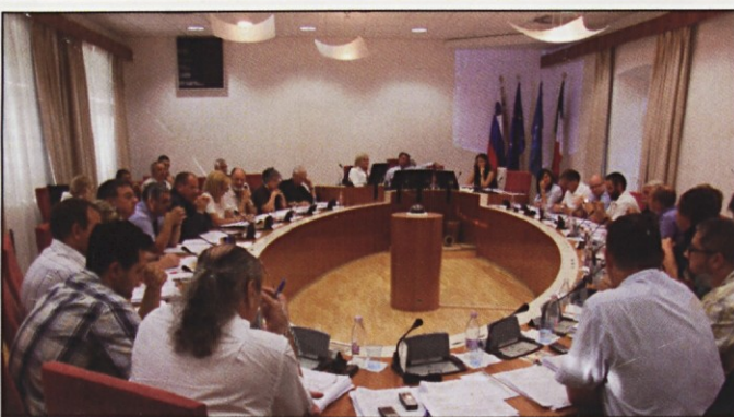
Občinski svetniki so sejali do poznih večernih ur.

Reševalna vaja "Plima 2009", ki je bila napovedana za soboto, 7.11.2009 odpade, so sporočili z občinskega urada.