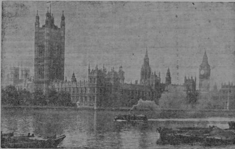
Nemci so bombardirali v minulem tednu med drugimi javnimi poslopji tudi angleški parlament v Londonu in londonsko elektrarno, ki je centrala za vso južno Anglijo. Slika na levi predstavlja parlament, slika na desni pa električno centralo.

Iya. Poizkus, udomačiti kamele v Ameriki, pa ni uspel. Podnebje jim ni prijalo, zato so vse kaj kmalu poginile. Z njimi je umrl tudi gospodar. Vojaki so mu postavili zgoraj opisani veličastni spomenik.