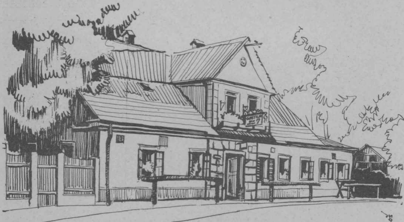
Janez Ošaben: 'Gostilna Pri sedmici', risba