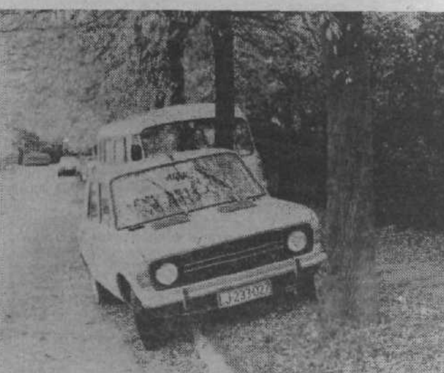
Je tudi to odraz naše kulture?

Folklorni odsek ima redne vaje vsak ponedeljek in četrtek ob 20. uri v prosvetnem domu, vsi ki bi želeli sodelovati pri delu folklorne odseka, dramske ali recitatorske skupine, pa lahko dobe informacije vsak torek od 19. do 20. ure v klubski sobi prosvetnega doma v Savljah.