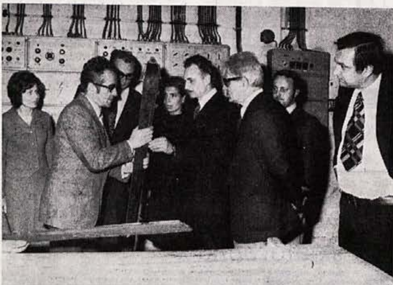
... in v obratu smučí, kjer z zanimanjem sledi proizvodnemu procesu