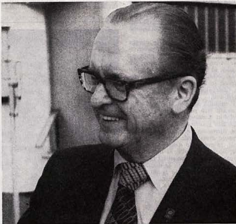
V drugem delu obiska smo imeli z njim tudi razgovor o Elanu, o asortimentu, prodaji in drugo.

Gosta smo sprejeli z veseljem in mu razkazali proizvodnjo smuči, za katero se je izredno in podrobno zanimal. Ogleдал si je tudi kolekcijo čolnov na skladišču pred obratom plastike.