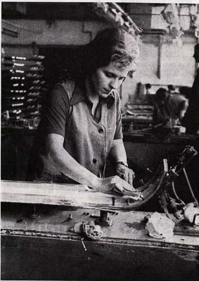
Pridne roke delavcev in delavk so največ pripomogle k boljšemu uspehu v 1. četrtletju