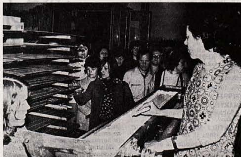
Mladinci iz Slovenijalesa z zanimanjem ogledujejo tiskanje smučí

Ceprav so se Elanovi mladinci odzvali v zelo minimalnem številu, mi-