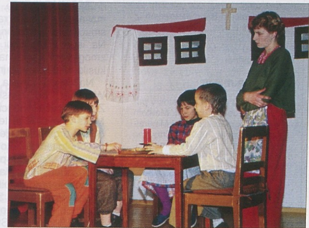
Scena je bila preprosta, toda prav zaradi tega še posebej učinkovita.