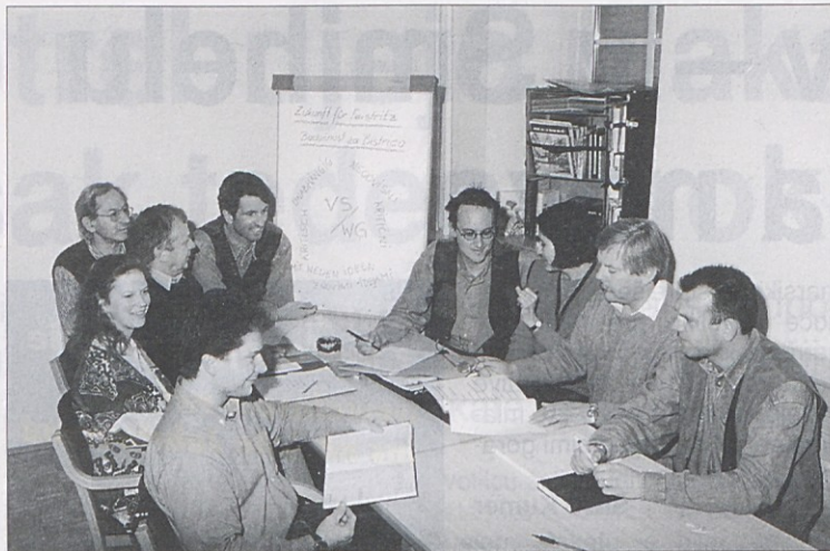
Na Bistrici v Rožu je VS sestavila zelo delaven in angažiran team.