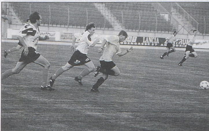
Igralci SAK bodo tudi vigredi tekli za žogo na celovškem stadionu.

Več ali manj je torej stoodstotno, da SAK vigredi ne bo tekmoval na igrišču ASV. Kar zadeva prihodnjo sezono (97/98), pa je še vse odprto, kajti znova se bo pogajalo.