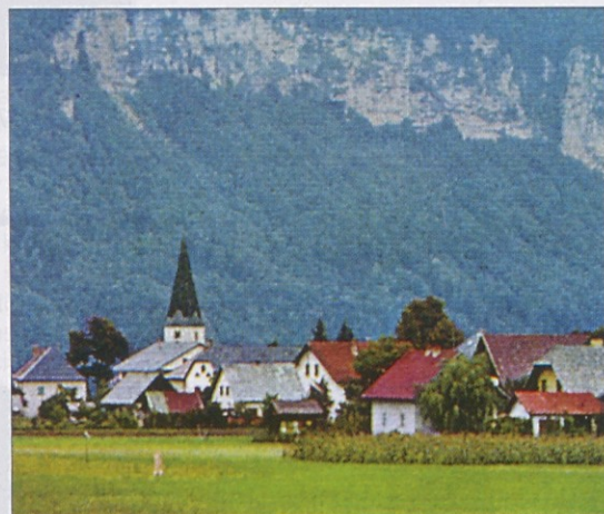
Kot edina občina bo Galicija ostala „čista“ volilni plakov. Vse frakcije se držijo sklepa.