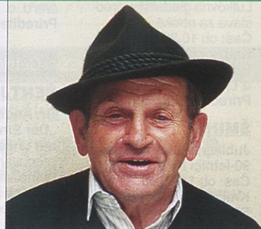
Piše: STANKO KRAUT