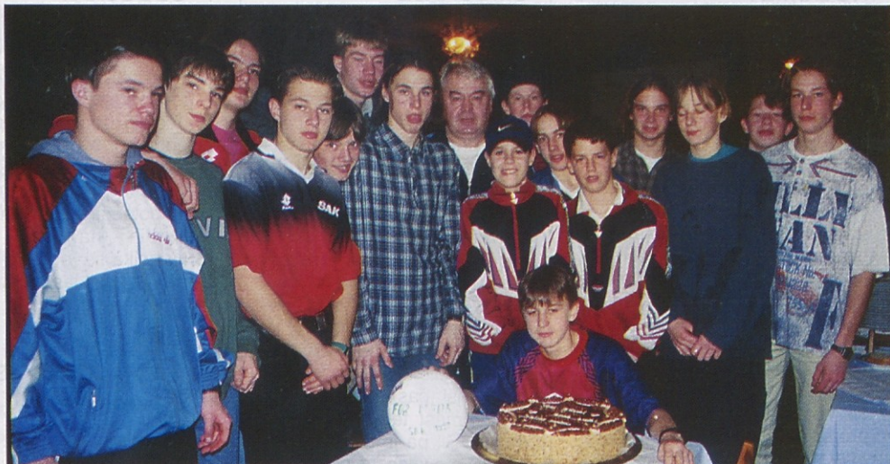
Slovo je bilo po letih tesnega prijateljstva zelo otožno: igralci SAK U 16 so svojemu angleškemu kolegu v slovo podarili veliko torto in nogometno žogo.