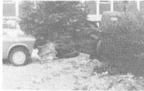
Takšen prizor preje prispeva k pridobitvi osata kot blagajane!

Če je Medobčinski sklad za izobraževanje delavcev na področju samostojnega osebnega dela Ljubljana Miklošičeva 26 doslej le vračal stroške obiskovanja tečajev, seminarjev in sol, bo odsej prešel še med organizatorje dopolnilnega izobraževanja delavcev pri obrtnikih. S tako obliko izpopolnjevanja znanj je pričel poskusno že spomladi za delavce v gostinskih lokalih v sodelovanju