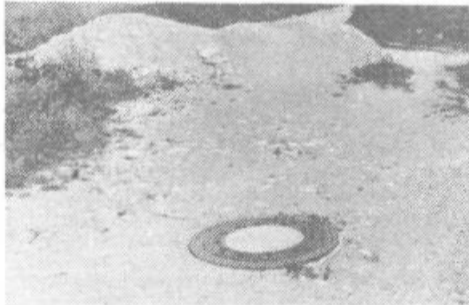
Gramozovo zimsko spanje?

Zelo žalostno pa je pogledati komaj urejene zelene (ki še dodobra ozelenele niso) ob pločnikih na