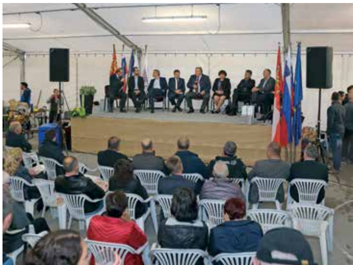
Logaški podjetniški forum z vrhunskimi poznavalci malega gospodarstva pri nas