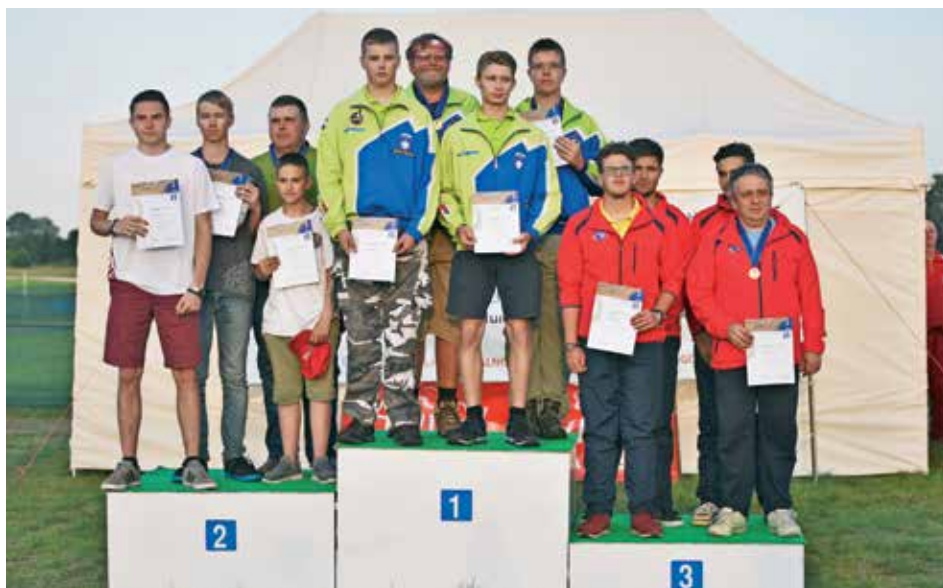
Prvo mesto mladinske ekipe v kategoriji S3A