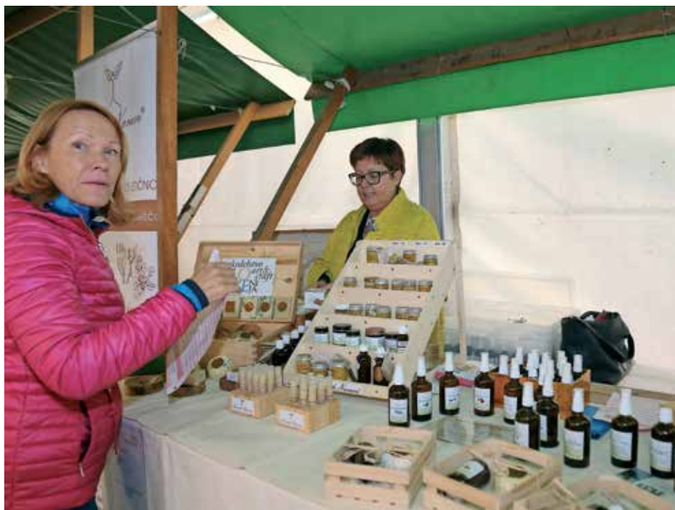
Ulica obrti in podjetništva

Z adnji poletni teden je bil podjetniško obarvan. Območna obrtno-podjetniška zbornica Logatec je tudi letos organizirala odmeven Teden obrti in podjetništva z namenom promocije logaške obrti, podjetništva in gospodarstva, pa tudi gostinstva, turizma in kmetijstva. Promovirali so lokalno – proizvedeno in pridelano na Logaškem. Vse dogajanje je obogatilo letošnji občinski praznik, zato so dogodke pripravili v sodelovanju in s podporo Občine Logatec, prizorišče pa je bilo pred Narodnim domom in na sedežu zbornice.