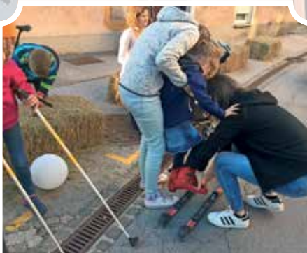
Tisti, ki so imeli dovolj poguma, so se zapeljali na rolgah Tekoškega smučarskega kluba Logatec in videli, da to ni šala.