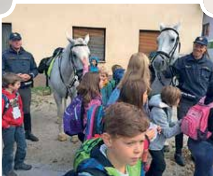
Policijska postaja Logatec in policisti konjeniki so navduševali predvsem mlajše obiskovalce.