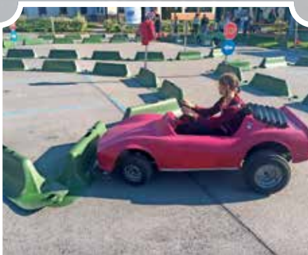
Kako pomembno je, da poznamo prometne znake in jih tudi upoštevamo, so v okviru prometne vzgoje otrok s programom JUMICAR spoznali mladi vozniki.