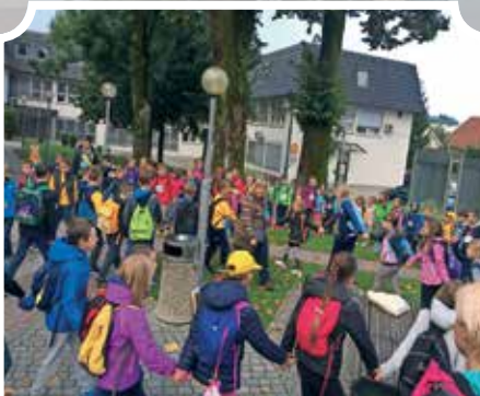
Dan brez avtomobila so druženju na cesti namenili učenci iz pobratene občine Repentabor in njihovi prijatelji z OŠ Tabor Logatec.