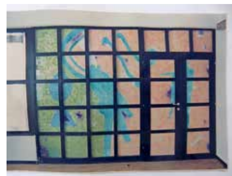
Del stene v 1. nadstropju