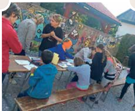
Da je ustvarjanje tudi del dneva brez avtomobila, so dokazali otroci v okviru številnih delavnic na Cankarjevi ulici.