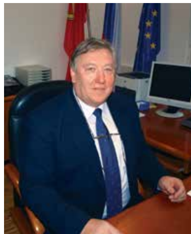
Spoštovani občanke in občani!

Logaški planinci trideseti na Triglav..... str. 27