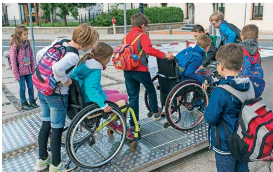
Z arhitekturnimi ovirami so se srečali tudi otroci.

Pri deljenem prevozu nam lahko pomagajo številne aplikacije in spletne platforme, koristi pa se pokažejo v študiji, ki je pokazala, da vsak deljeni avto s cest in ulic odstrani kar nekaj zasebnih avtomobilov. Zato je prav, da se vključimo v široko in pisano paleto prizadevanj za spremembe naših potovalnih navad in naredimo nekaj za zmanjšanje onesnaženosti, ki jo povzroča promet. Poleg hrupa in onesnaženosti zraka bomo s tem izboljšali tudi kvaliteto življenja. V Sloveniji se je z različnimi aktivnostmi v letošnji Evropski teden mobilnosti vključilo 70 občin in veliko število različnih organizacij, zvez in društev. Med njimi tudi Društvo paraplegikov ljubljanske pokrajine, ki je sodelovalo na tretjem Ovirantlonu v Ljubljani, teden pa 22. septembra sklenilo v Logatcu z Dnevom brez avtomobila. Občanom Logatca smo na stojnici z različnimi publikacijami in medicinsko-teh-