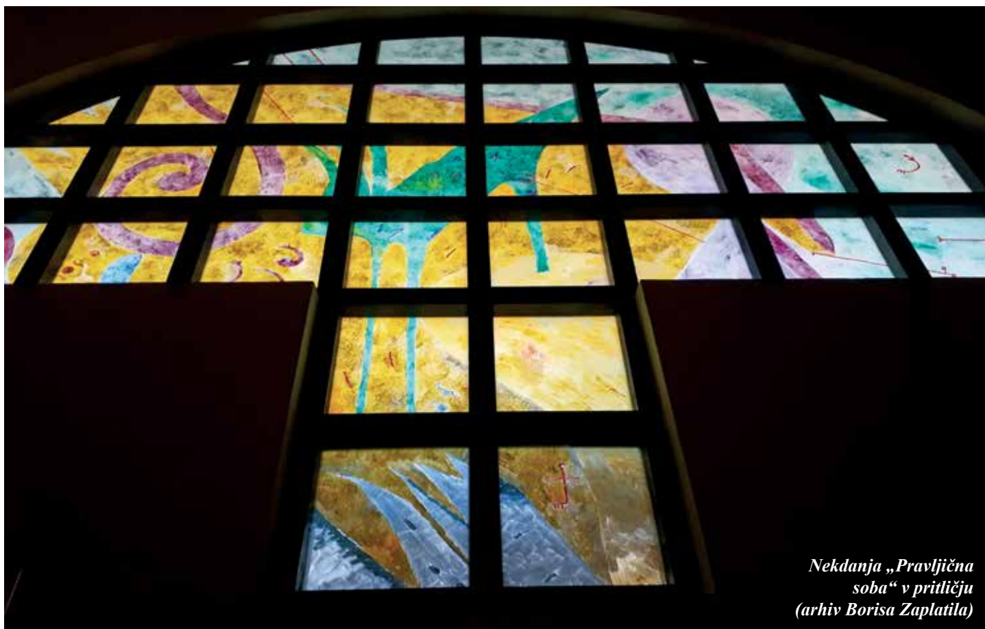
Nekdanja „Pravljilna soba“ v pritličju