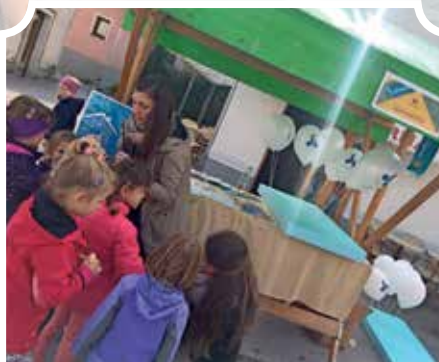
Da se v Logatcu lahko brezplačno vozimo z Lokalnim potniškim prometom, je bilo moč slišati iz občinske stojnice.