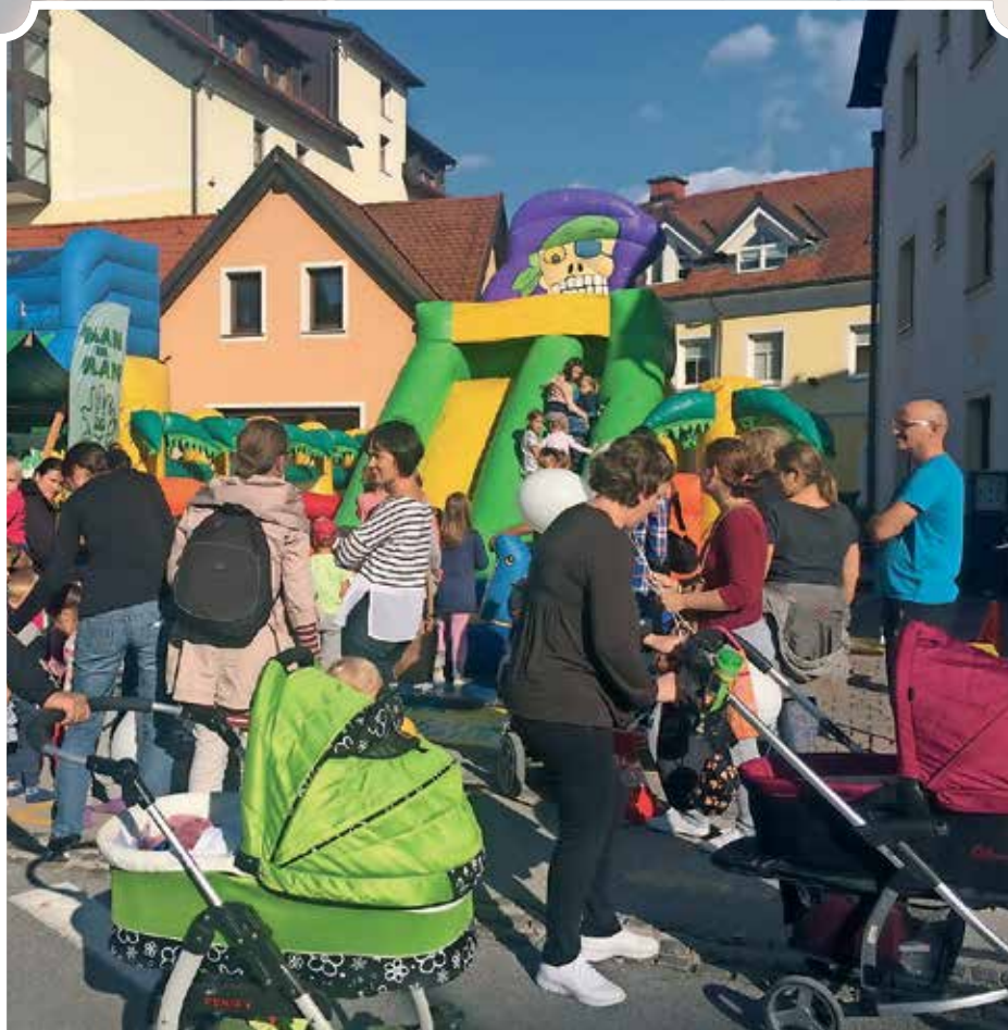
Pred napihljivim toboganom MŠKD Dlan na dlan so se vile vrste čakajočih otrok in staršev.