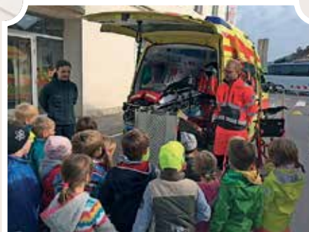
Obiskovalci so z velikim zanimanjem prisluhnili ekipi Zdravstvenega doma Logatec, ki je podala številne informacije v zvezi z reševalnim vozilom ter jih poučila, kako ravnati ob poškodbah, če pademo z rolerji ali kolesom.