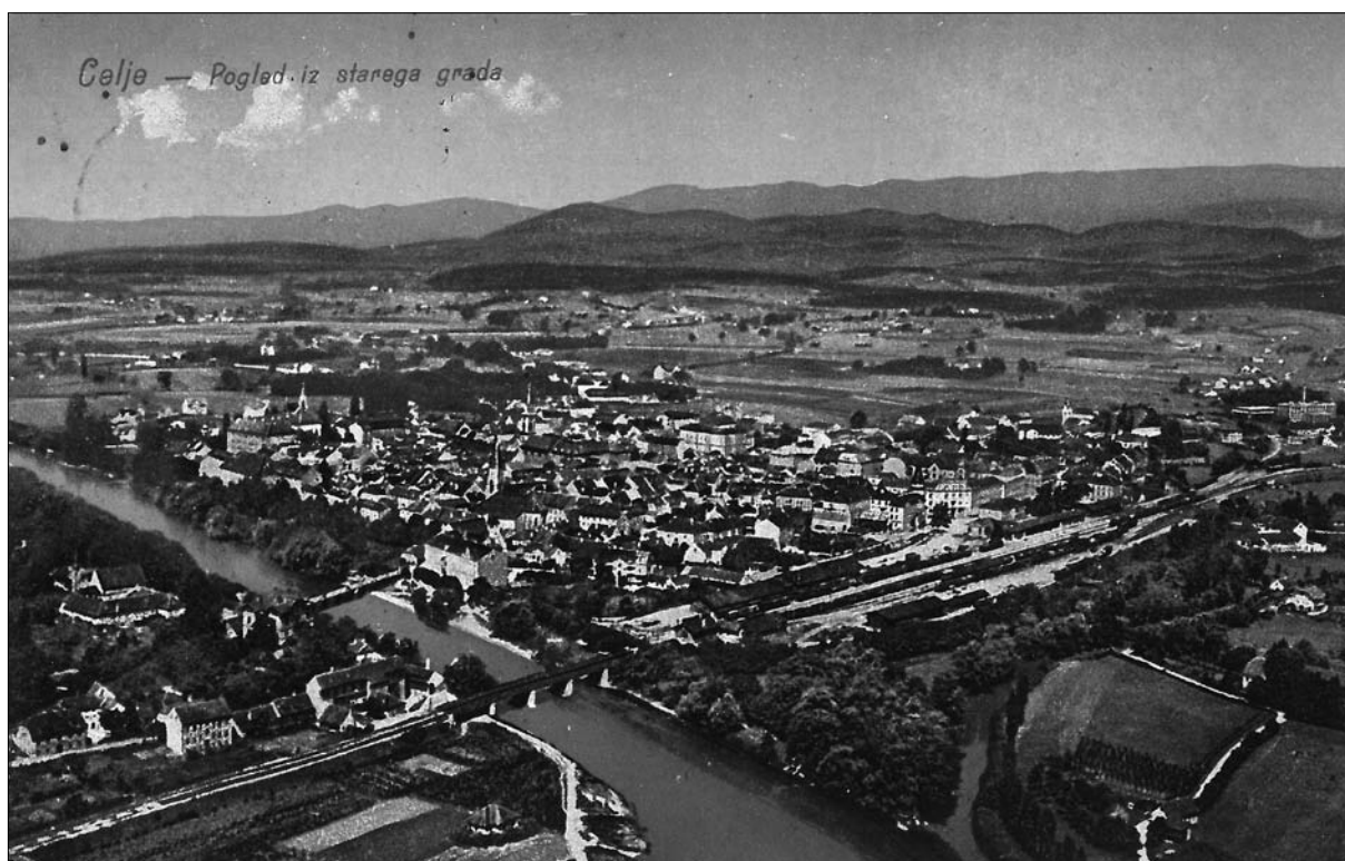
Celje, pogled s Starega Gradu na prelomu v 20. stoletje.