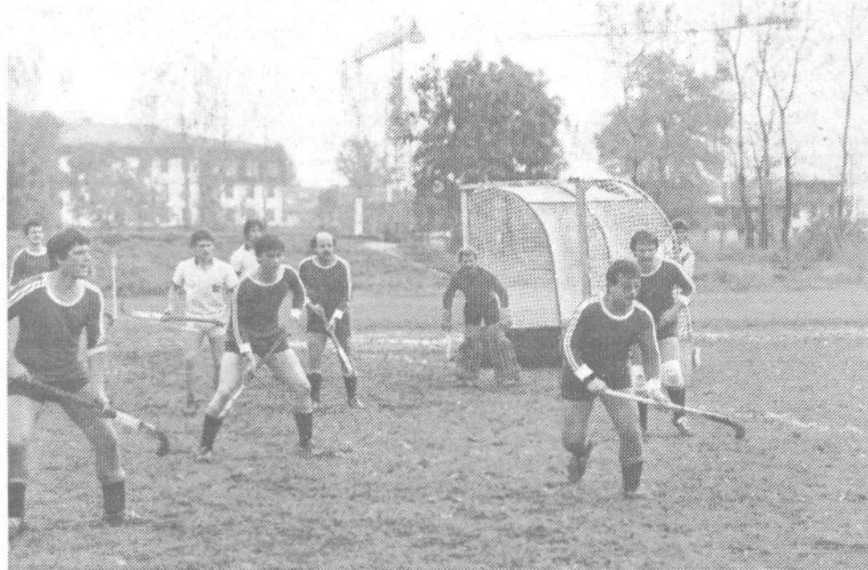
Običajno gledamo hokejiste na ledu - toda tekme na travi so prav tako zanimive.