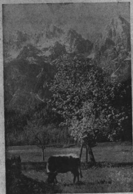
Pozna pomlad v planinah.

Izdaja konzorcij (Stanislav Hafner). Za uredništvo odgovarja Stanislav Hafner. Uredništvo in Uprava: Miklošičeva 7, Ljubljana. Tiska Misijonska tiskarna. (A. Trontelj).