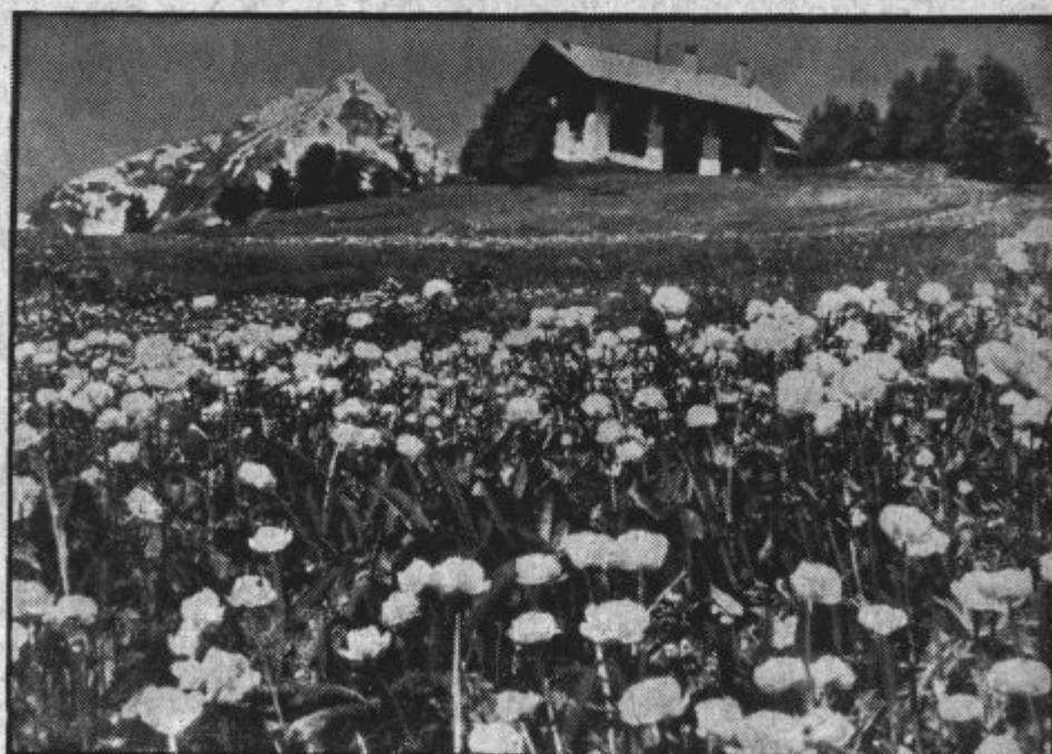
St. Moritz v cvetju.