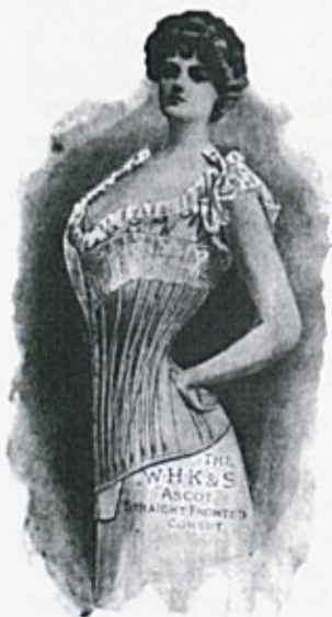
Ženski korzet, 1902

Modo na prelomu stoletja (1895-1915) je spremljal nov odnos do oblačenja. V svetu je čedalje bolj prevladovalo spoznanje o zdravem in udobnem ženskem oblačilu, ki naj dokončno opusti toliko stoletij veljavni in nezdravi steznik. V Evropi so ustanavljali zveze in društva, ki so se zavzemala za zdravo žensko telo. Toda poslavljanje od tega oblačilnega kosa je trajalo vse do prve svetovne vojne. V bistvu bi lahko rekli, da se je reformirana ženska obleka okoli leta 1900 postopoma že uveljavila, hkrati z njo pa je bila v modi obleka, ki je s svojo značilno S linijo in steznikom nadaljevala tradicijo 19. stoletja. Z značilno modno linijo 'vitko in zleknjeno' telo, kjer so bili boki in trebuh popolnoma utesnjeni.