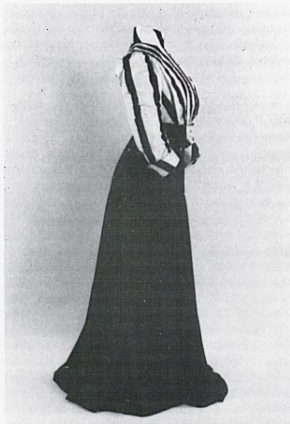
Dvodelna obleka, 1903

Vidnejši korak k svobodnejši in bolj praktični modi je bil storjen, ko so stopile v veljavo dvodelne obleke. Kasneje so se v skladu z reformiranjem uveljavili tudi ženski kostimi in z njimi bluze, se pravi dnevno oblačilo, ki si je poleg oblek za slovesnosti in večerne ure izbojevalo trdno mesto v ženski garderobi. Ideal bluze je obstajal v tem, da so že tako pogosto prozorno bluzo zgoraj globoko izrezali in ta izrez