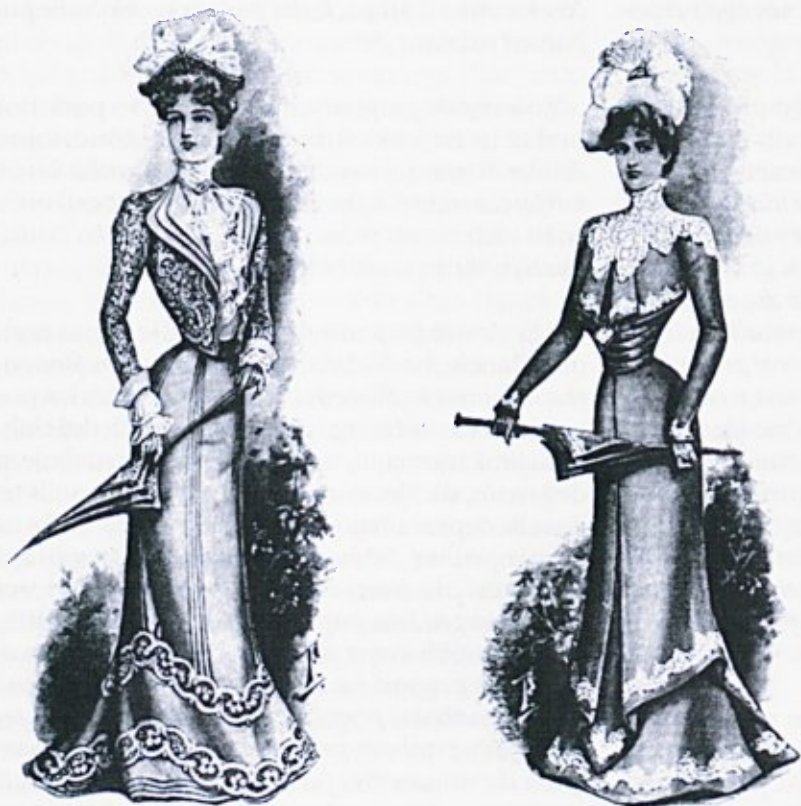
Noša iz leta 1900

prah, krati vid, škoduje koži in nosu ... Pajčolane mogli bi z zdravniškega stališča le odobravati, če bi imel namen prikrivati gnjusne in nalezljive bolezni obraza ... Šminke. Vsaka mati naj bi svoje hčere neprestano opozarjala na to, da je poleg zmernega življenja navadna voda in groba brisača najboljše sredstvo za lepoto polti ... Grda, občenevarna razvada so dolge igle za klobuke ... Čemu pa nosijo dame steznik ali moderca? Le ker je moda ... Na mestih kjer ga zategujejo, ovira steznik izhlapevanje kože, zaradi tega se ta mesta vse življenje poznajo kot rdečkaste ali modre lise ... Že imenovane lise in brazde pa opazamo tudi pri ženah, ki ne nosijo moderca. Pri teh leži vzrok v zatezanju kril ... Ovratniki dam so ponavadi previsoki in preozki ... Vsled preozkih ovratnikov trpi odtok krvi, posledica so glavobol, vrtoglavost in neuralogija ... Zelo škodljive so nogavične podveze, če preveč zatezujejo, in sicer so bolj nevarne okrogle tanke, kakor ploščnate, bolj nezdravo je, če jih imamo pod kakor pa nad kolena ... Neverjetno je, da čevlarji še danes napravljajo čevlje, ki jih lahko menjaje nosimo na obeh nogah. Čevljar izkuša nogo, kosti, meso in kožo od obeh strani sem kolikor možno stisniti in spraviti v čim manjšo obliko ... To je – če človek anatomske misli – naravnost nemogoče in že pri otrokih moramo paziti