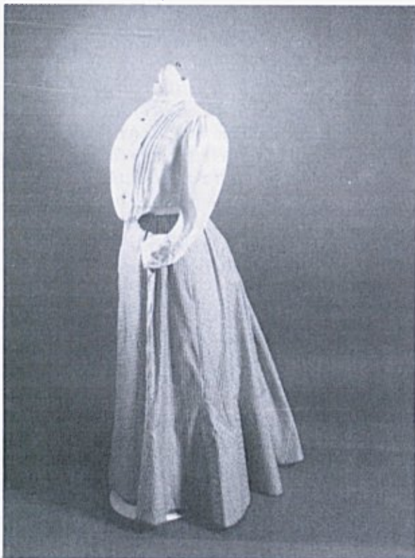
Ženska bluza in krilo, začetek 20. stoletja

Nekoliko drugačnega mnenja je bila Danica, ki je februarški številki Slovenke objavila članek z naslovom Modne zmote . Spotaknila se je ob damске klobuke, ki so bili takrat v modi: “Zdaj mi pa prav odkritosrčno povejte, drage bralke, če so ta ptičja gnezda na glavah naših dam res okusna in lepa. Tu čepi mali nežni kolibri, tam se šopiri krasna rajčica, z onega klobuka vihra valovito nojevo perje. Prav lepa zbirka, res, bi to bila za ptičji razpredelek kaknega muzeja ... Zakaj bi se pa ne postavilo na klobuk kako mlado mace ali kaka bela miška. Gotovo bi naredila ravno isti efekt, samo da jo prične nositi kaka merodajna kapaciteta na modnem polju ...” V nadaljevanju pa si želi dame prevzgojiti in osvestiti v naravo-varstvenem duhu: “Če je res moda zvesto zrcalo omike svoje dobe, onda znači ta noša pač civilizacijo v – povojih.