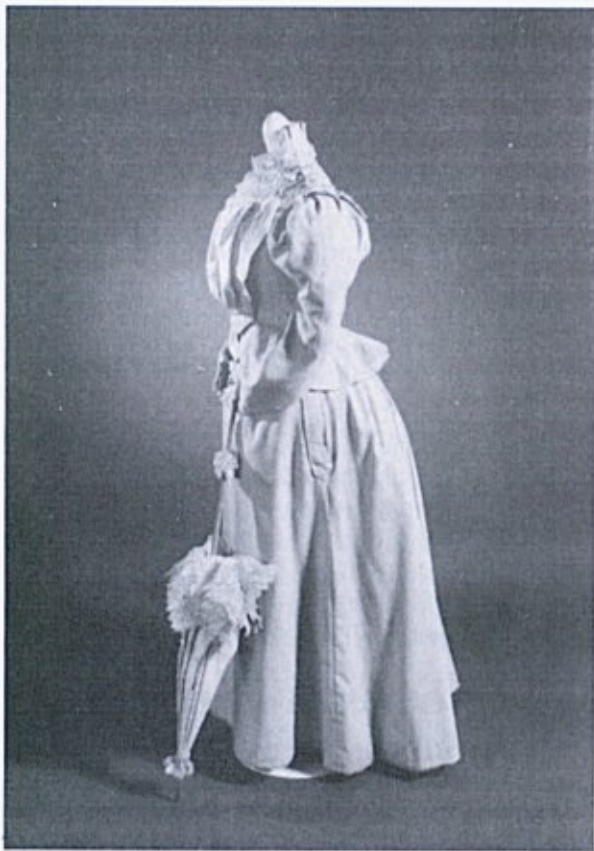
Ženska obleka, konec 19. stoletja

dili aktualnim in ne več zastarelim modnim napotkom. Moda je bila dosegljiva vsakomur, obvladati je bilo treba le nekaj krojaškega ali šiviljskega znanja in že si si lahko ukrojil sodobno obleko. 3