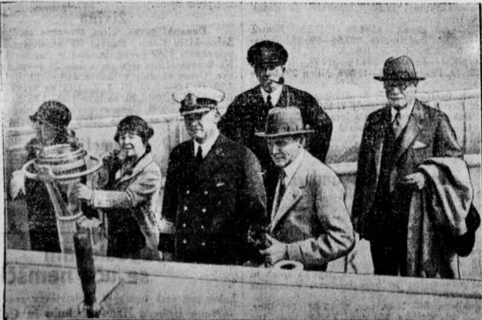
Henry Ford na poti v Evropo na krovu parnika »Bremen«, katerega je v Cherbourgu zapustil, da nastopi svoje inspekcijsko potovanje po Evropi. Na sliki je Ford drugi od desne.