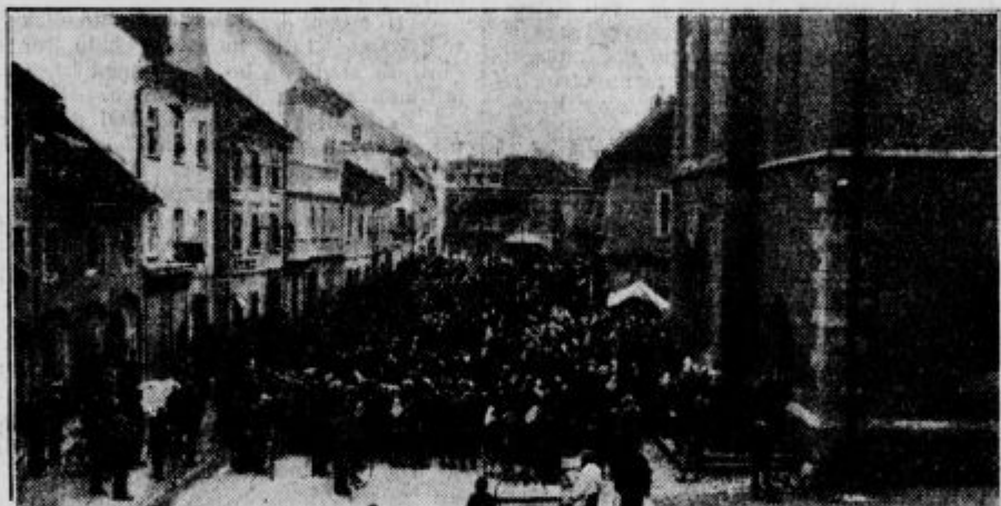
Sprevid prihaja v cerkev.