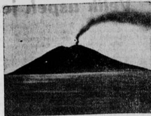
Ognjenik Stromboli na istoimenskem otoku pri Siciliji, ki je te dni izbruhnil in povzročil strahovito škodo. Dve vasi sta popolnoma uničeni, 5 oseb je mrtvih, nad 30 pa ranjenih. Zadnjič je Stromboli izbruhnil leta 1919.