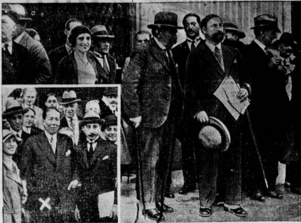
Otvoritev zasedanja Društva narodov v Ženevi; Briand zapušta po svojem prvem velikem govoru o Panevropi na otvoritveni seji palače Elektorat. Na levi: Predsednik plenarnega zasedanja, romunski zunanji minister Titulescu zapušta otvoritveno sejo.