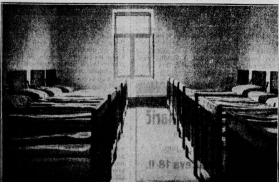
Spalna soba v delavskem domu.