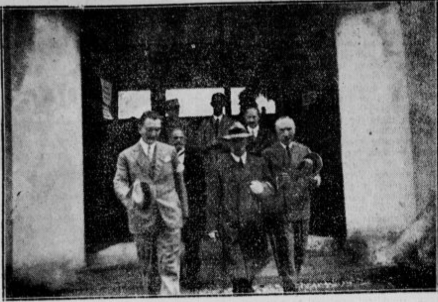
Ljubljana, 15. septembra.