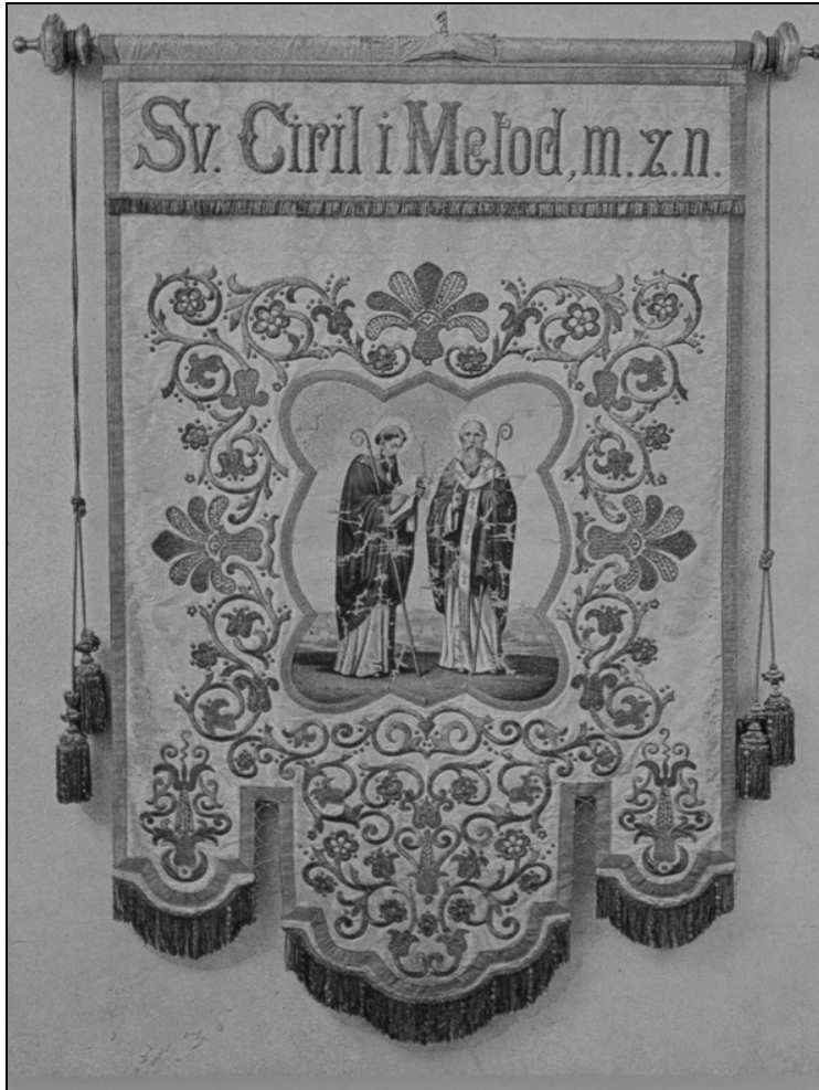
Sl. 4: Društveni prapor bratovščine sv. Cirila in Metoda pri sv. Jakobu v Trstu, razvit 19. maja 1900 (objava v Zastava, sveta bodi ti nam vez, Trst 1997, s. 172).

zveze (Lega Cristiano-sociale) s sedežem v Trstu, območje njenega delovanja pa je bilo celotno Avstrijsko primorje. Italijanska krščanskosocialna stranka je začela zlasti po italijanskih središčih, nato pa tudi v njihovem zaledju ustanavljati podružnice pa tudi društva Mladinske socialne zveze (Lega gioventù sociale).