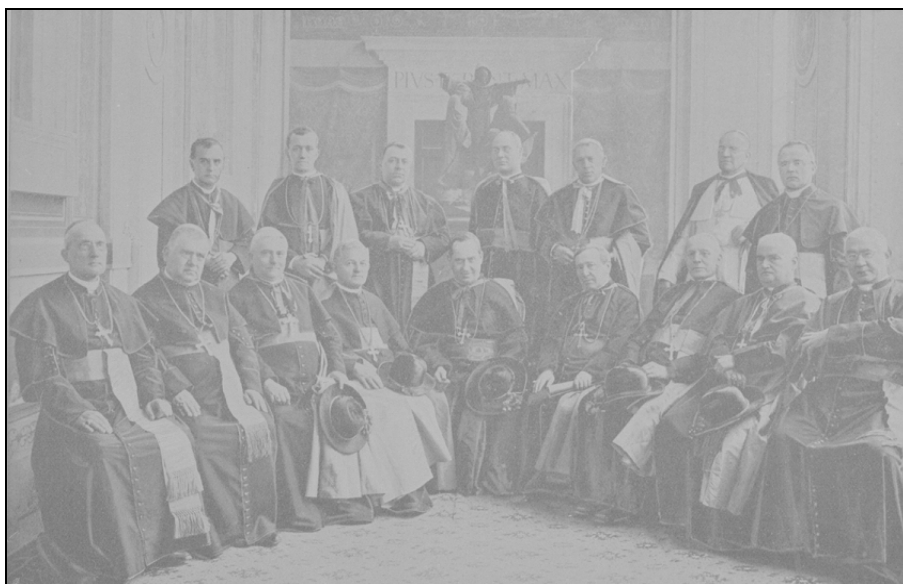
Sl. 3: Slovenski in hrvaški škofje pri posvetovanju o glagolici v Rimu od 21. – 31. maja 1905.