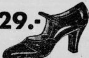
Vrsta 9895-8 Eleganten čevljiček iz laka z okusnim okrasom, primeren za vsako priliko.