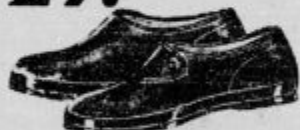
Najopravnejše za delo doma in po dvorišču so naše »ZEPE«. Ker imajo gumijasti podplat, so nepremočljive. Otroške Din 29.-, moške Din 39.-