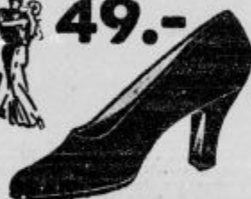
Vrsta 9815-05 Okusen salonski čevljiček iz tinega baržuna ali setena. Ne sme manjkati v garderobi nobene praktične dame.