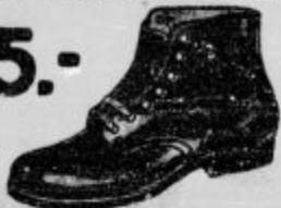
Za dečke, ki nikdar ne mrujejo ovo, dobrih visokih čevljev iz močnega mastnega usnja in s trpeznim gumijastim podplatom. Vel. 36-38 Din 59.-