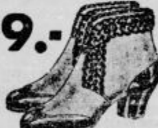
Vrsta 335 Udobni toda elegantni čevlji iz toplega volnenega sušina z okrašenim robom iz krimerja. Za občutljive noge v zimski dobi nenaomestljivi