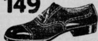
Čevlji elegantnega gospoda za družbo in ples iz laka, kombinirani s semišem.