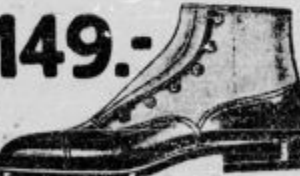
Elegantni čevlji iz telečjega boksa, zgornji del kombiniran s tolim suknom. Radi svoje otmennosti imenovani »DIPLOMATSKI«