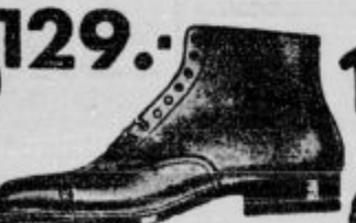
Elegantni čevlji šivani na ram. Izdelani iz najboljšega boksa z usnjem podplatom in peto.