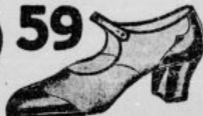
Črni ali rjavi baržunasti kombinirani z usnjem elegantni in udobni za vsako nogo in vsak žep, lahko jih obujete v snežke