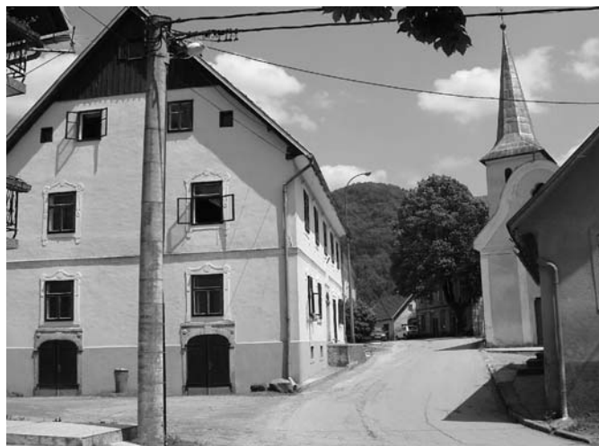
Središče Plešč s Palčevo hišo.

Po gospodarskem zastoju in katastrofalni poplavi, ki je prizadela železarske obrate v začetku osemnajstega stoletja, ko je bila po ohranjenih poročilih tudi vsa ostala dolina eno samo blato, je novi lastnik začel po nekaj desetletjih intenzivno delati na regulaciji rečice in urejanju novih poti. Tako je bil v drugi polovici osemnajstega stoletja postavljen lesen most čez Kolpo v Gašparcih, ki je omogočil cestno povezavo ob Kolpi po hrvaški in nato slovenski strani do Osilnice in naprej zopet na Hrvaško stran do vasi Plešče. Tu se je nadaljevala težje prevozna pot naprej do Čabra. Prav ta pa je povzročila potrebo po razvoju vasi Plešče, kjer se je lahko naselilo