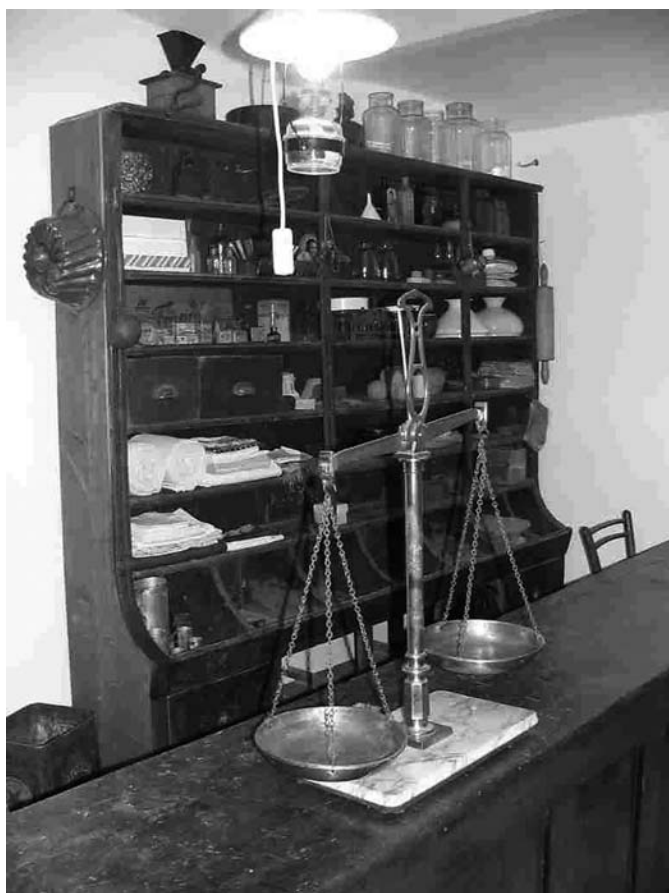
Trgovina iz devetnajstega stoletja.

premožnejšim mogoče naročati tisto, o čemer so prejšnje generacije v oddaljenejših krajih lahko samo sanjale. Po trgovskih poslih se je iz Plešč odhajalo na potovanja v Kočevje, Reko, Rakek, Postojno, Ljubljano, Zagreb pa tudi dlje do Gradca in Dunaja.