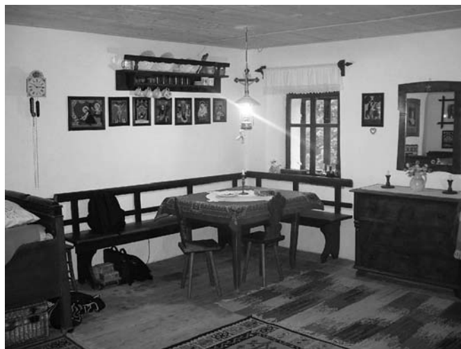
Oprema hiše na podstrehi.

Palčava hiša je bila zgrajena pred velikimi revolucijami v vsakdanjem življenju naših prednikov in preden so ti začeli pri gradnji na široko uporabljati nove tehnične dosežke, kar je sledilo v drugi polovici 19. stoletja. Kot vse večje zgradbe v okolici so jo gradili italijanski mojstri, ki so med izgradnjo južne železnice s svojimi ekipami potovali po večjih gradbiščih v tem delu dežele. Tloris, vsa druga temeljna arhitekturna razdelitev in elementi so izdelani v klasicističnih razmerjih, ki izhajajo iz zlatega reza. Zgrajena je še na klasičen način, iz lepo obdelanih in skrbno izbranih kamnov, po pripovedovanjih so kamenje iz okolice vozili dve celi leti kar z dvema paroma volov. Najtežji kamen, odkrit pri obnovi v severnem zidu hiše, ima po oceni celo več kot 450 kilogramov, za njegovo dvigovanje je bilo potrebnih vsaj dvanajst močnih delavcev.