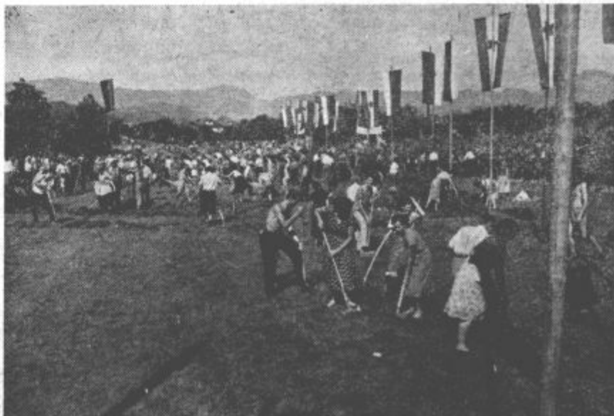
2. septembra 1956... V sončno jutro so plapolale zastave, lopate in krampe prostovoljcev pa se zarili v zemljo, da bi napravili Paki novo korito

Nedvomno bodo v celoti uspeli! To nam zagotavljajo njihovi dosežani uspehi, zagotavlja nam dovršitev prvega, nad 300 metrov dolgega dela nove rečne struge, po kateri bo Paka danes stekla.