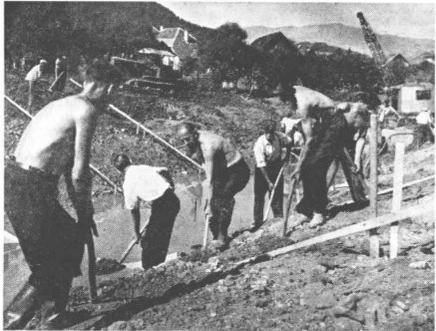
Inženir in rudar, obrtnik in kmet, upokojenec in mladinec — vse je delalo in trgalo zemljo kos za kosom iz nove struge

Mar ni Nova Gorica zrasla z delom mladinskih brigad? Mladinci iz vse Slovenije, Hrvaške, Srbije in Makedonije so se združili in postavili temelje sedanjemu kapitolu slovenske goriške pokrajine. Ne primorska vročina, ne kraški veter nista mogla ukloniti volje mladine in njene ustvarjalne sile. Marsikateri je od napore v silni vročini omahnil — vendar prenehal ni. Ko si je opomogel, je delal s podvojeno močjo, da nadoknadi tisto, kar je med omedlevo zamudil. »Slabič nisem, če morejo drugi, morem tudi jaz«, je sikal skozi priprta usta, ko je vihtel svoje orožje — kramp. Njegovo delo je obrodilo! Poleg kubikov premetane zemlje je dosegel še nekaj, kar pa je prav tako ali pa še bolj važno, ojeklenil je svoj značaj! Po