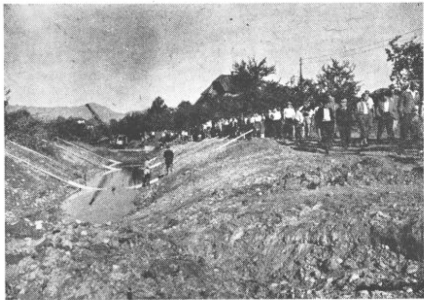
Reka nas je strnila v enotno in mogočno Šaleško četo, ki bo odslej složno in požrtvovalno klesala naši dolini nov obraz

V letošnjem 7% povečanju sodeluje povečanje storilnosti s 50% in boljše izkoriščanje kapacitet le z 2%. Znano je, da postavlja letošnji družbeni plan storilnost na prvo mesto. Seveda pa se storilnost stalno postavlja pred naš plačni sistem in kaže nizka storilnost tudi nekatere hibe našega sistema nagrajevanja, ne moremo pa trditi, da nosita vsjo krivdo. Velika pomanjkljivost je bila tudi pri določevanju norm, pa tudi premij nismo v celoti letos izkoristili. Storilnost v letošnjem prvem polletju je nižja kot lani. Proizvodnja se je namreč v razmerju z zaposleno delovno silo premalo dvignila. Družbeni plan je predvideval novih zaposlitev (Nadaljevanje na 3. strani)