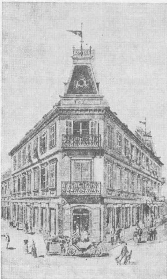
Hotel Nadvojvoda Ivan (Erzherzog Johann) v Mariboru zdaj stanovanjska in poslovna hiša na vogalu Gosposke in Slovenske ulice