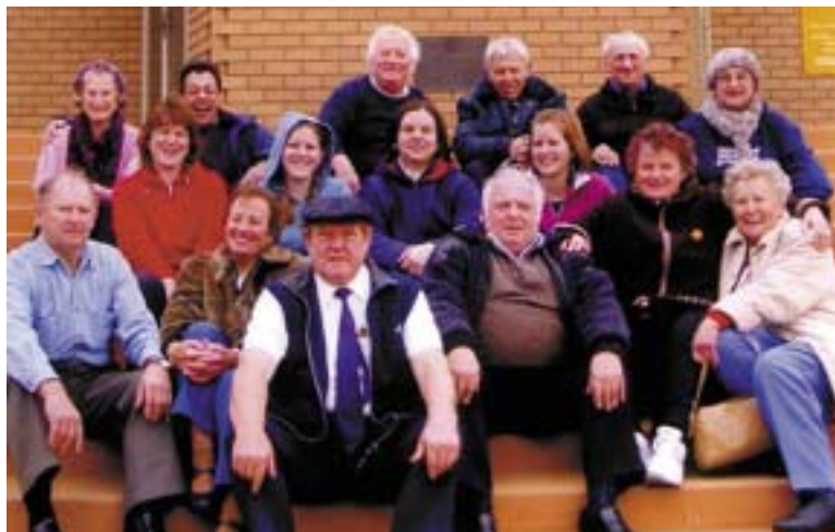
Igralska družina Merrylands na stopnicah cerkve v Kew z voznikom avtobusa, ki jih je že pripravil za novo pot.