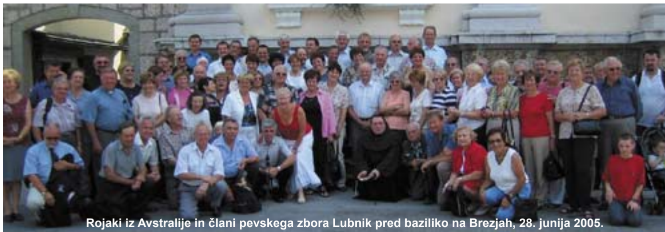
Rojaki iz Avstralije in člani pevskega zbora Lubnik pred baziliko na Brezjah, 28. junija 2005.