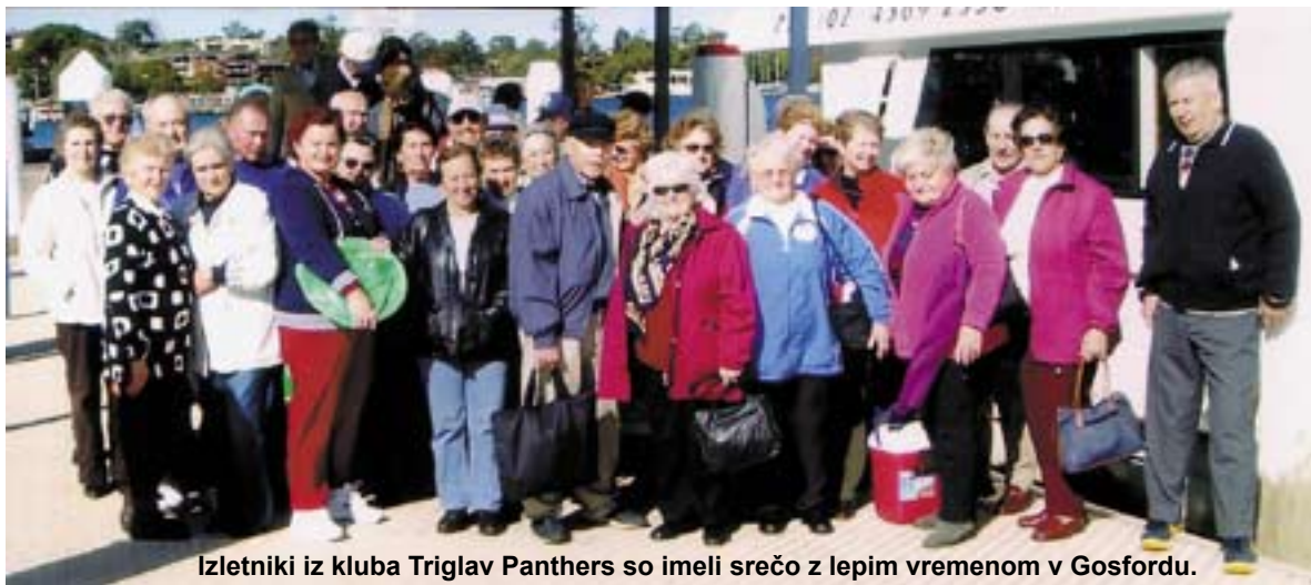
Izletniki iz kluba Triglav Panthers so imeli srečo z lepim vremenom v Gosfordu.