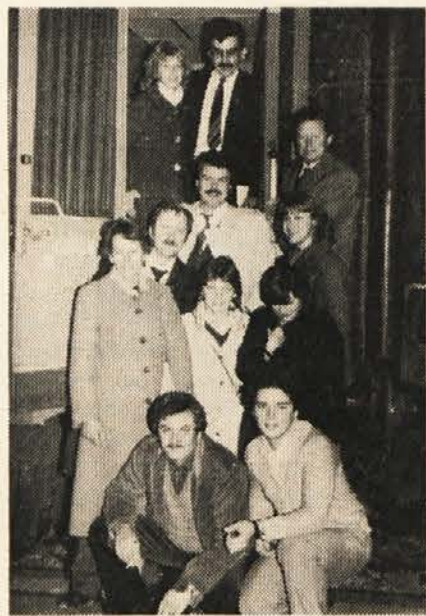
ODDAJA RTV LJUBLJANA: