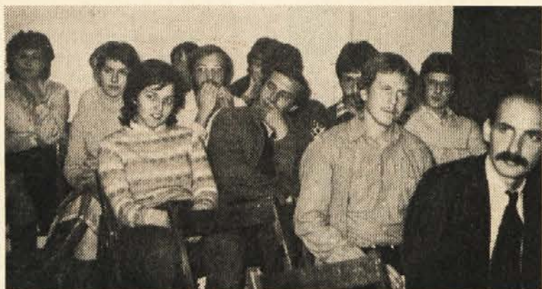
Slovenski študentje se v novih prostorih odlično počutijo