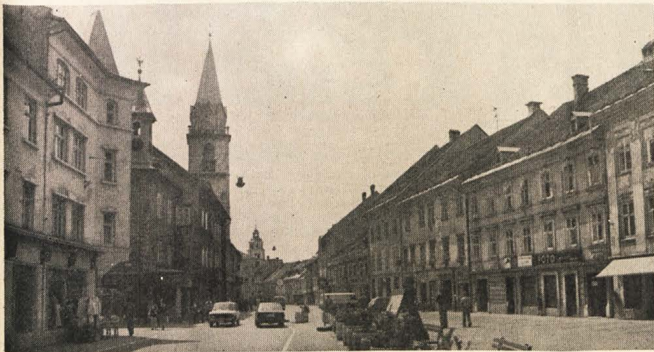
Panorama Titovega trga s Prešernovo ulico v ospredju

V osrednjem delu Gorenjske leži občina Kranj. Ceste, ki vodijo prek mejnih prehodov Jezersko, Ljubelj, Podkoren in Rače iz srednjeevropskih držav proti jugu, se stekajo v Kranju. Vendar Kranj ni zgolj križišče teh poti. Mesto se z zanimivo arhitekturo dviga nad sotočjem rek Save in Kokre.