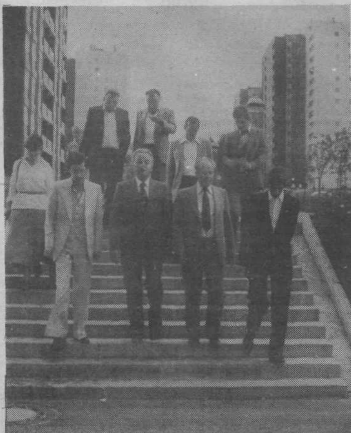
Predsednika zvezne konferenčne SZDL so krajanji popeljali po naselju.