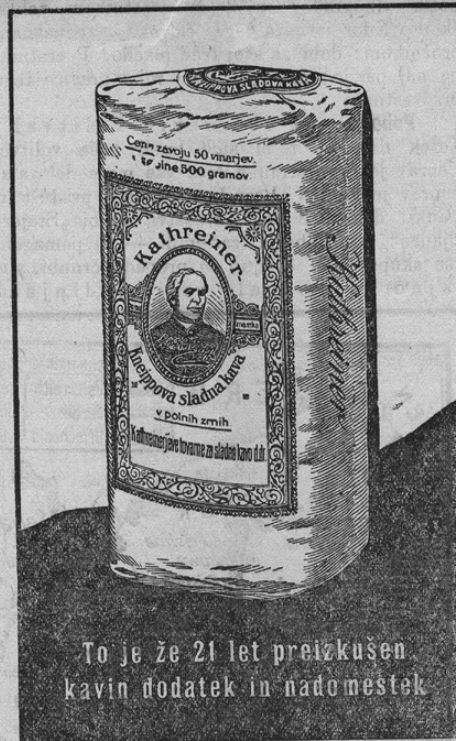
To je že 21 let preizkušen kavin dodatek in nadomestek