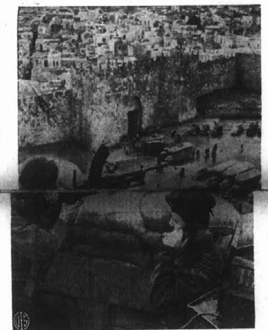
Na straži v Jeruzalemu. — Na strehi bivšega nemškega poslanstva je nastanjena angleška vojaška straža. Slika nam predstavlja dva angleška vojaka v stražni službi. Straže širom mesta so v telefonski zvezi med seboj. Spodaj pa je videti zgodovinke Damaščanka vrata, ki vodijo v arabski del mesta.