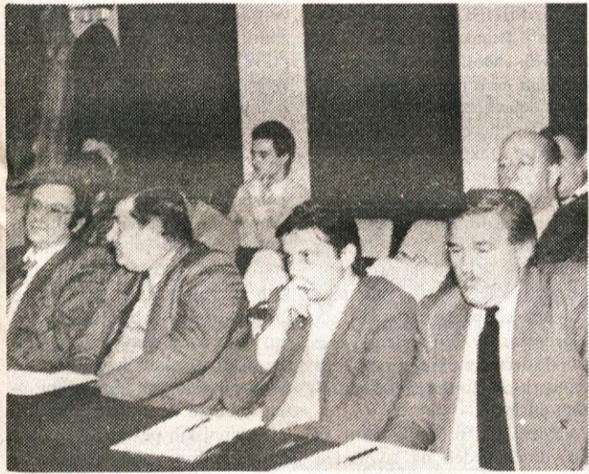
Z zbora »Okrogla miza«

obravnavo in razpravo strnili v več skupin in ob zaključku o vsaki skupini vprašani sprejeli tudi predloge in usmeritve. V razpravi naj bi poleg ostalih področij obravnavali predvsem: