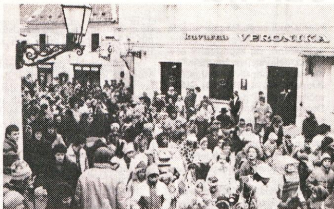
Pustni sprevod za otroke

V sredo, ko je bil torkov Živ-žav že mimo, so pusta »končno« in