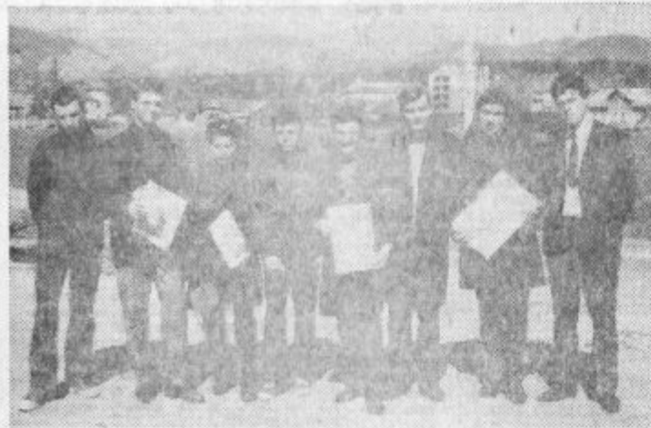
Mladinski aktiv lesnoindustrijskega kombinata Soštanj je v prostorih termoelektrarne priredil tekmovalje v namiznem tenisu mladinskih aktivov.