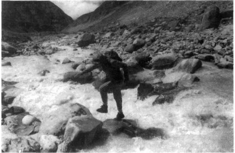
Prehod čez reko: navzgor smo jo preskakovali od kamna do kamna, navzdol smo se zapejati po vrvi.