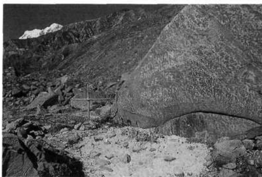
Za nami je ostal samo tale napis na skali