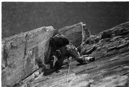
V skalnem delu stene