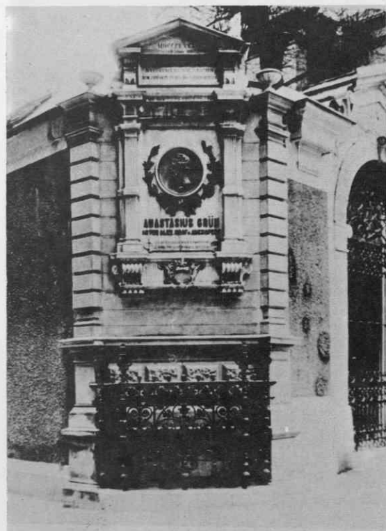
Nekdanji Grünov spomenik (zdaj Marijino znamenje), Ljubljana

Leta 1889 pa so Slovenci dočakali spomenik Valentina Vodnika in s tem prvi javni figuradni spomenik enega svojih pomembnih mož. 10 Izbrali so mu prostor pred nekdanjim licejskim poslopjem, ki je spomeniku dajalo neprimerno boljše ozadje kakor pa sedanji odprti prostor ljubljanskega živilskega trga. Vodnikov kip je zmodeliral kipar Alojzij Gangl, tedaj še študent dunajske akademije, odlili pa so ga na Dunaju. Z realistično oblikovano stoječo figuro je Gangl posegel po že uveljavljenih, klasičnih spomeniških rešitvah in z natančno formulacijo osebnosti zadovoljil pričakovanja sodobnikov. Vodnikov spomenik je imel za slovenski narod reprezentativni