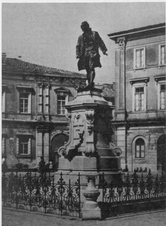
Tartinijev spomenik, Piran