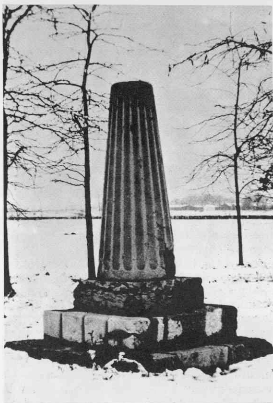
Spomenik umrlih vojakov, Ljubljana-Studenec