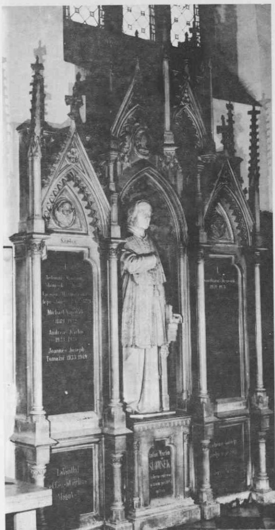
Slomškov spomenik, Maribor

Slovenci so že dobrih deset let po vsej deželi zbirali prispevke tudi za javni figuradni spomenik, ki bi ga postavili zaslužnemu škofu in narodnemu buditelju Antonu M. Slomšku v Mariboru. Celopostavni marmorni kip škofa so naročili Francu Zajcu, ki se je še zlasti potrudil za portretno zvestobo. Na Štajerskem je bil nemški pritisk močnejši kot na Kranjskem, ki je nasploh veljala za najbolj slovensko deželo. O tem, da bi Slomškov spomenik stal na javnem trgu, ali npr. pred cerkvijo sv. Alojzija, nemško liberalna mestna občina ni hotela niti slišati. Tako so kip, obdan z neogotskim ahritekturnim okvirom, postavili v prezbiterij mariborske stolnice, kjer je tudi Slomškova grobnica. S tem je spomenik sestopil v vrsto nagrobnikov z znano dvojno vlogo. Tudi njegovo odkritje leta 1878, pri katerem so »v duhu sodelovali vsi Slovenci«, so ovirali nemški liberalci. 8 Pač pa so ti na začetku osemdesetih let dali postaviti značilne figuralne javne spomenike, kakršni so enaki uvoženi litoželezni kipi Jožefa II. v Mariboru, Celju in