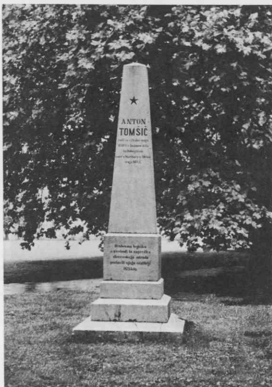
Tomšičev spomenik, Maribor

Sredi petdesetih let začne ustvarjati prvi slovenski kipar, ki se je izobrazil na tuji, münchenski akademiji, Franc Ksaver Zajec. Dotlej so delovale predvsem podobarske in kamnoseške delavnice z mojstri, vendar so bili njihovi izdelki, razen redkih izjem, na obrtniški ravni. Leta 1860 so posvetili spomenik škofu Antonu A. Wolfu v ljubljanski stolnici; Franc Zajec je iz marmorja mojstrsko izklesal njegovo portretno doprsje. Prav tako je sedem let pozneje izdelal reliefni portret misijonarja Knobleharja za njegov spomenik v župnijski cerkvi v Škocjanu pri Novem mestu. A izdelavo portretnega doprsja avstrijskega feldmaršala Josepha Radetzkega je ljubljanski občinski svet zaupal slavnemu dunajskemu kiparju Antonu D. Fernkornu. Spomenik z bronastim doprsjem, odkrit leta 1860, je kot osrednji