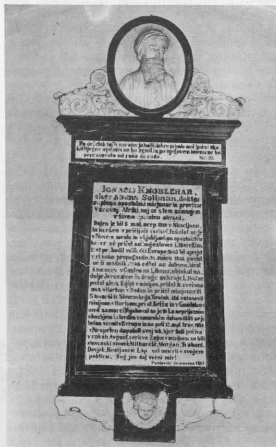
Knobleharjev spomenik, Škočjan pri Novem mestu