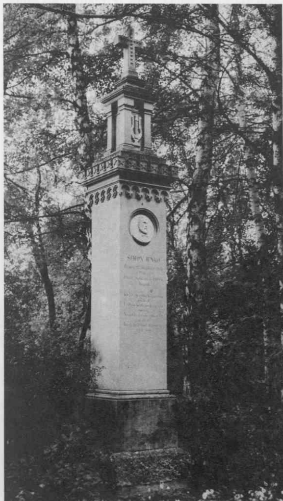
Jenkov nagrobni spomenik, Kranj

Prvi pomebni Slovenec, kateremu so želeli postaviti javni spomenik s celopostavno figuro na podstavku, je bil Valentin Vodnik. V šestdesetih letih so se vrstila mnenja o pomenu takšnega spomenika za narod, o njegovi lokaciji in materialu. Akcija ni uspela, čeprav so bili izdelani celo načrti. Leta 1873 so slovesno odkrili nagrobni spomenik pesniku Simonu Jenku na kranjskem pokopališču (zdaj Prešernov gaj), dve leti pozneje pa časnika-ru Antonu Tomšiču na mariborskem pokopališču (danes stoji spomenik na Leninovem trgu). 6 Formalno ponavljata že znane sheme arhitektonskih spomenikov, le da je Jenkov obogaten s portretnim medaljonom. Medtem so se po evropskih mestih, spominimo se samo dunajskega Ringa, razbohotili javni figuralni spomeniki historizma, pri katerih so se uveljavljale večkrat megalomanske dimenzije in razkošne scenerije. 7 Njihova podoba je specifična: upodobljenec, večinoma celopostaven, retorično in teatralno, v zvesto podanem oblačilu, z rekviziti, ki določajo njegov stan in dobo, obdan z alegorijami, reliefi in napisi, ki govorijo o njegovem pomenu in zaslugah, stoji privzdignjen na podstavku. Čeprav so si ti spomeniki močno podobni, so nemalokrat postali neločljiv del mestne vedute, celo več kot to – znamenitost mesta, njegov razpoznavni znak.