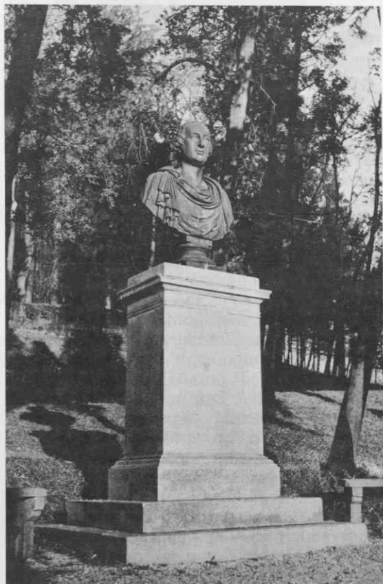
Attemsov spomenik, Rogaška Slatina