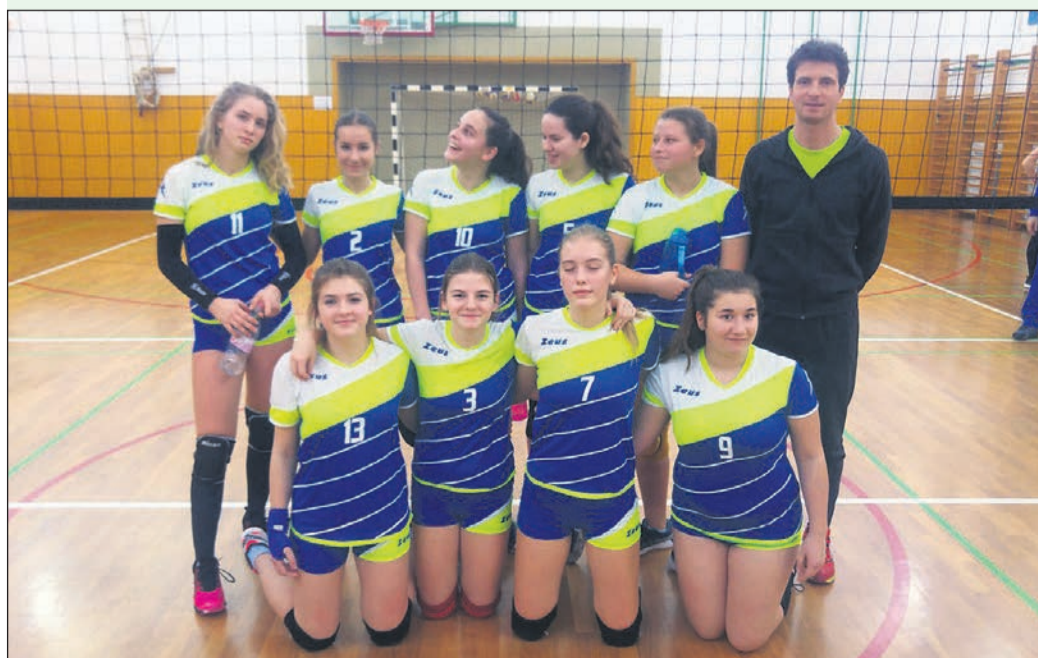
Ekipa OŠ Breg se je uvrstila v finale, kjer je izgubila proti domačinkam.