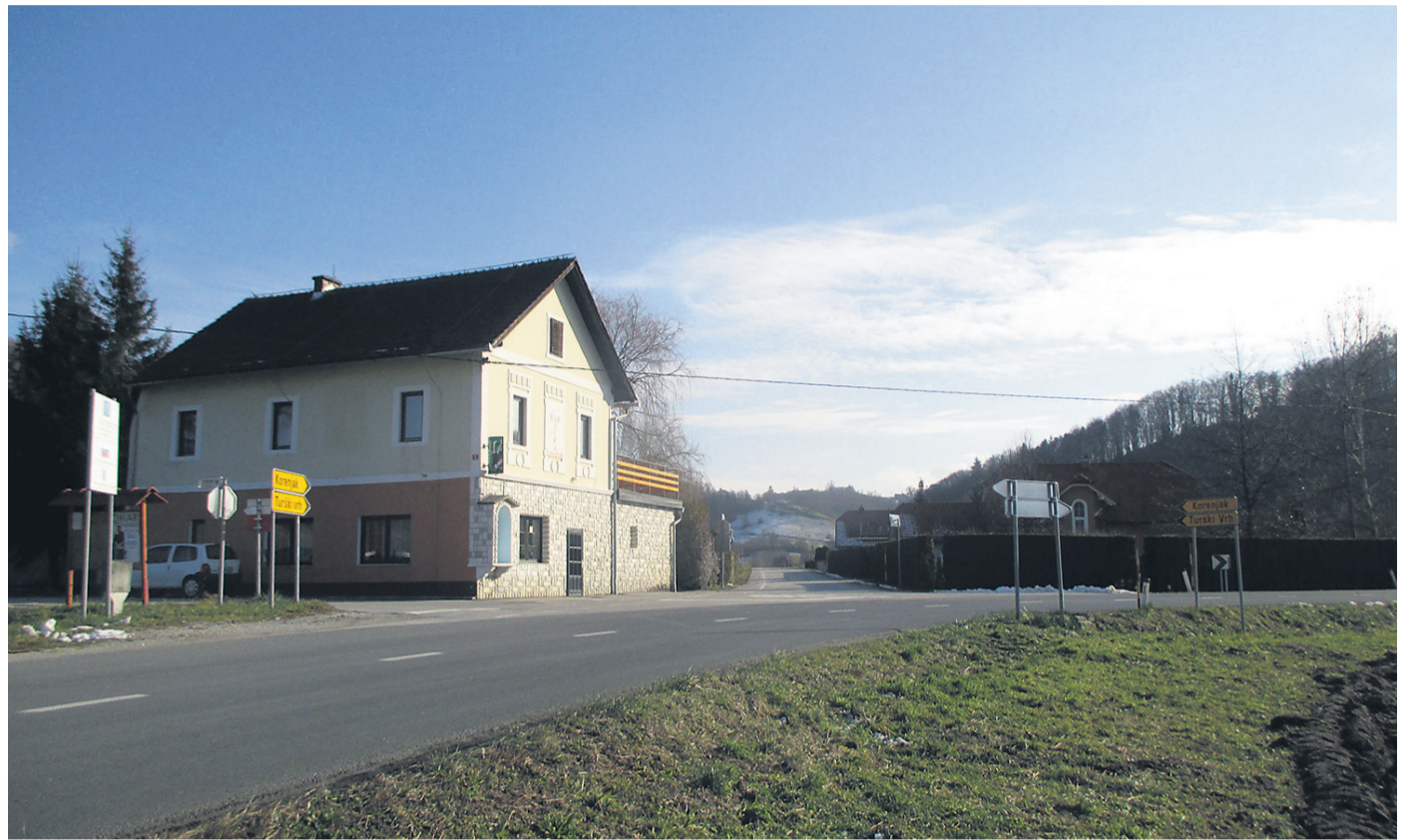
V križišču pri Cirkulanah en smerokaz kaže proti Turškemu Vrhju, drugi pa proti Turškemu vrhu ...

Pa gremo v ali na Vrh? Vsaj pri Majskem Vrhju ne moremo zgrešiti ... Snój je pojasnil, da gre pri izbiri predlogov zgolj za ustaljeno rabo pri domačinih, ki jo mora upoštevati tudi knjižna norma, ponekod pa sta dovoljeni obe varianti: »V več slovenskih krajevnih imenih se predlog na umika običajnejšemu v. Pri Vojniku je npr. naselje Ilovca, ki se prav tako veže z obema predlogoma: v Ilovci ali na Ilovci. Tudi za Jeruzalem velja podobno; nekateri rečejo, da gredo v Jeruzalem, drugi pa na Jeruzalem. Če lokalna raba ni ustaljena, če se uporabljata oba predloga (navadno na uporabljajo starejši, v pa mlajši), priročniki zapišejo obe.«