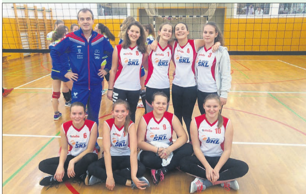
Zmagovalna ekipa območnega tekmovanja v odbojki za dekleta: OŠ dr. Jožeta Pučnika Črešnjevec