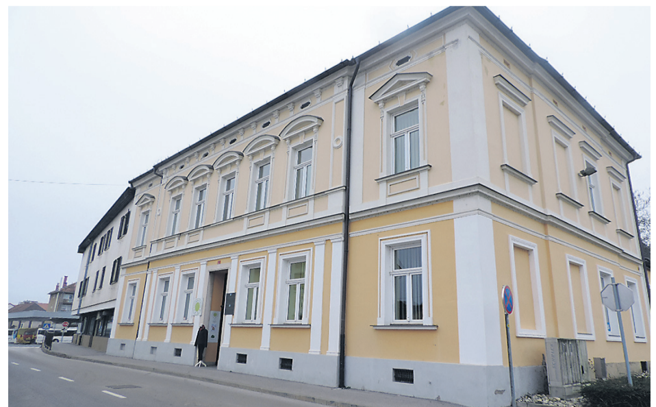
Stavba, kjer domujeta tudi Javna razvojna agencija Občine Ormož in Mrežni podjetniški inkubator, je naprodaj.

Kot nam je sporočil upravitelj, pa zanimanje »Konkretnega interesa ni, kljub znižanju izhodiščne cene na 10 % glede na prejšnji postopek, ni zaznati.«