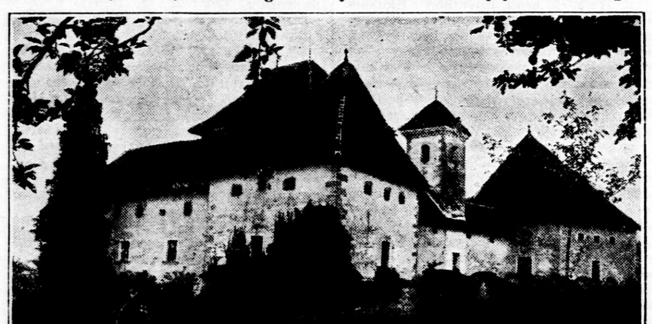
Grad Otočec, raj dolenske zemlje

Četrta ure proč raste iz vinogradov grad Vrhnovo. Vitki topoli ga obkrožajo, slavna zgodovina in čar gorjanskih bajk ga ovijata v skrivnosten pajčolan. V tem gradu