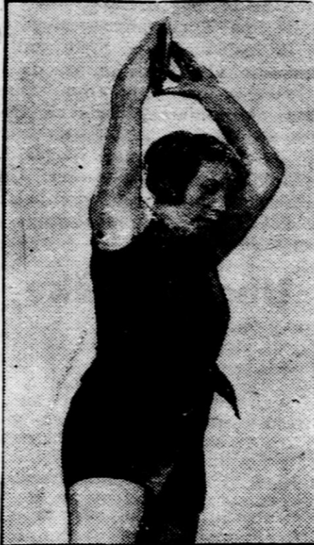
Poljakinja gđ. Weiss iz Lodza je dosegla v metu diska na 42.43 m nov svetovni rekord.