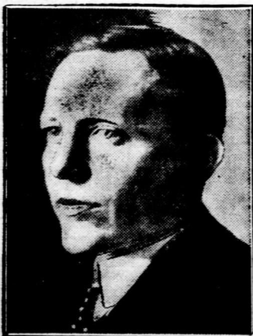
finančni minister v Papenovi vladi.