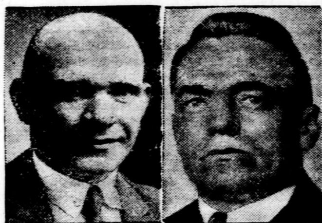
Levo predsednik nemške komunistične stranke Ernst Thälmann, desno vođa komunistične frakcije v državnem zboru Wilhelm Pieck.