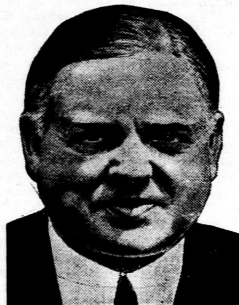
Prezident Hoover, ki si zadnje čase mnogo prizadeva, da bi pomiril duhove v Evropi in našel izhod iz kritičnega položaja sveta.