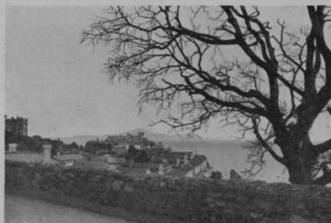
Angleška voj. naselb. v Gibraltarju. Zadaaj na sliki obala Afrike.