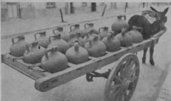
Vodo peljejo v lončenih posodah, v katerih ostane dolgo časa sveža. Na Gibraltarju ni mnogo pitne vode.