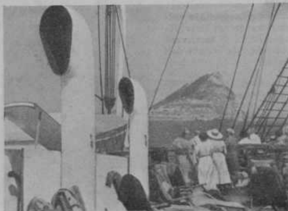
Levo: Potovanje mimo gibraltarske skale.

Na vojni ladji pred Gibraltarjem. Anglija je zbrala zadnje mesece močno brodovje v Gibraltarju, da bi oplašila Italijo. Bajе se pa Italijani tokrat Angležev ne bojijo preveč, ker vedo, da ne mislijo resno. Gibraltar je že več kó 200 let v angleški posesti ter je edina angleška kolonija v Evropi. Angleška trdovratno drži to svojo posest, saj s temi skalami, spremenjenimi v trdnjavo, gospodari čez celo Sredozemsko morje. Količnega pomena je Gibraltar za Angleško, se vidi danes, ko Angleži ravno vsled zavesti, da gospodarijo v Sredozemskem morju iz Gibraltarja, upajo edini voditi gospodarsko vojno proti Italiji. Gibraltar na eni strani in Suez na drugi strani Sredozemskega morja bosta odločila tudi v abesinski vojni.