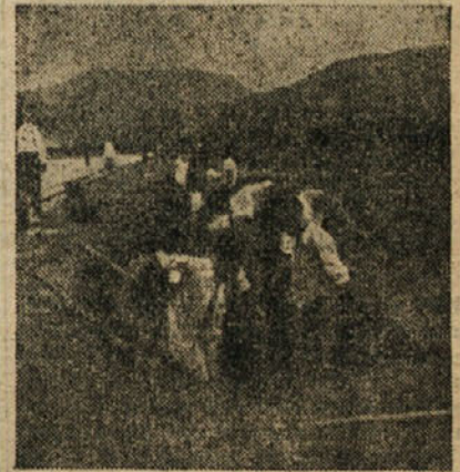
Brigada št. 5 iz Cola si je priborila prehodno zastavico v trajno last

»... brigada številka 5 — Col, 14 ljudi...« mi je bilo dodeljeno v soboto popoldne na sestanku statističarjev. Nisem bila zadovoljna, ker Col, kol sem slišala, ni bil med najboljšimi. In še samo 14 ljudi! Zavidala sem tistim, ki so jih imeli 100, 200 in še več. Kaj bo opravilo 14 ljudi iz Cola! Niti misliti ni, da bi mogli tekmovati za prehodno zastavico z drugimi brigadami iz »dobrih« vasi, ki so bile prijavljene dokaj številno. Udala sem