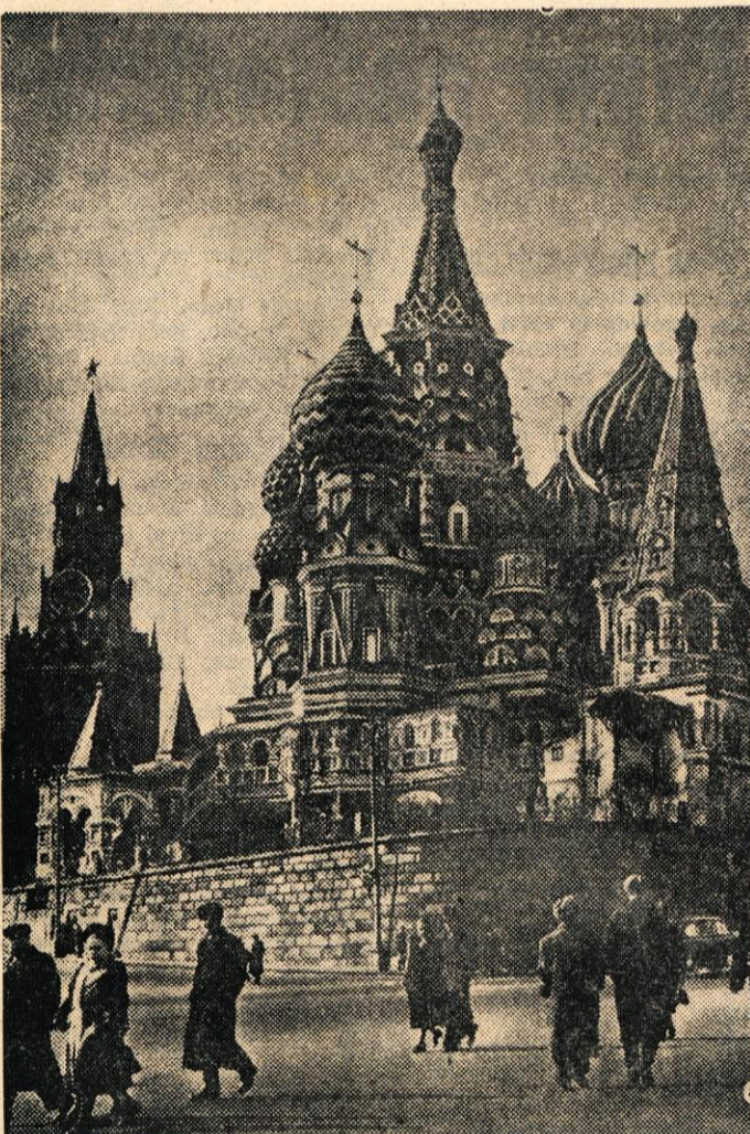
Ena izmed številnih arhitekturnih znamenitosti Moskve; katedrala Vasilija Blaženega, zgrajena v 16. stoletju.