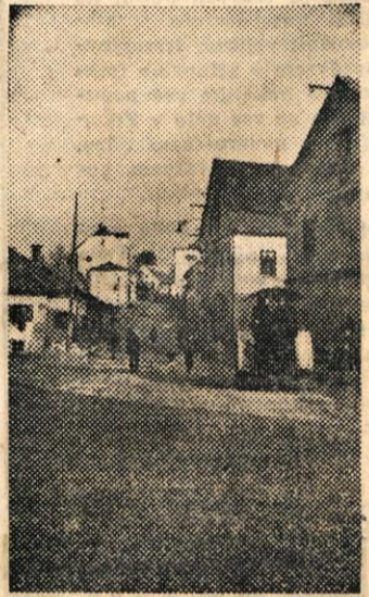
Polovico Partizanske ceste v Novem mestu so medtem že tlakovali, za ostanek pa potrebujemo še nekaj lepega vremena

UREJUJE uredniški odbor — Odgovorni urednik Tone Gošnik — NASLOV UREDNISTVA IN UPRAVE: Novo mesto, Cesta komandanta Staneta 30 — Poštni predal Novo mesto 33 — TELEFON uredništva in uprave št. 127 — Rokopisov ne vračamo — TISKA Časopisno podjetje »Slovenski poročevalec« v Ljubljani