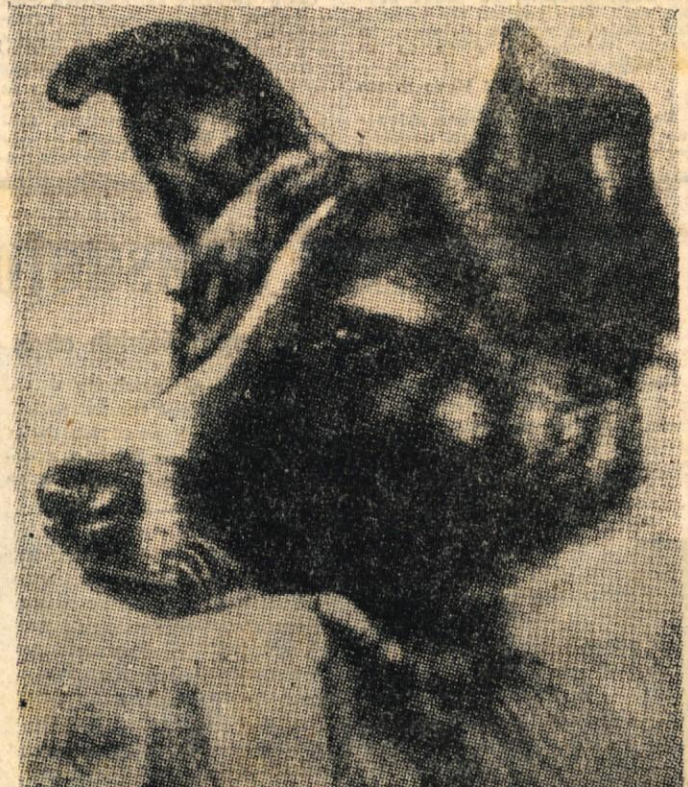
Psička Lajka neposredno pred poletom v vesolje

Vendar se je človek doslej dvignil visoko že 30 tisoč metrov. Problem te višine za človeka je tehnika rešila s posebno kabino, v kateri so isti pogoji kakor na Zemlji. V višinah vlada izreden mrz, nad zemeljskim ozračjem pa visoka temperatura. Toda tehnikom bo nedvomno uspelo zgraditi kabine, ki bodo potnike