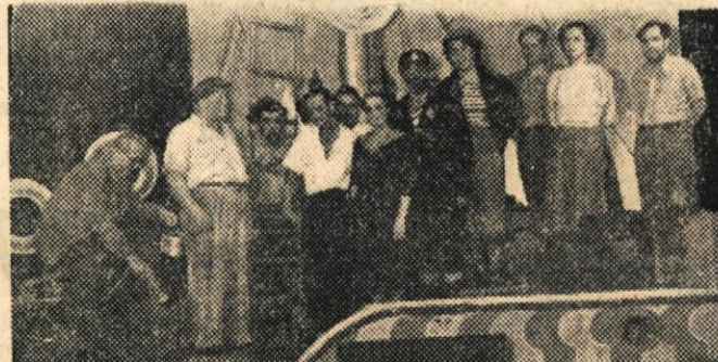
Igralci in sodelavci O'Neillove drame »Anna Christie«, s katero bo novomeško gledališče v kratkem gostovalo v Ljubljani. — Režija prof. Tone Trdan.

Posebni voz, napolnjen z blagom in predmeti iz velikih trgovskih magazinov, vozi sedaj skozi vso Litvanijo (v Sovjetski zvezi). Namen te trgovine v vagonu je, da bi se uslužbenca na majhnih postajah in kmetje lahko oskrbeli z istim blagom, živili in predmeti, kakor prebivalci velikih mest.