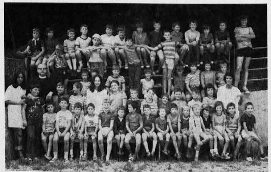
Dečki v počitniški koloniji SLOKAD v Dragi