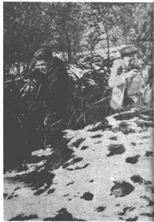
Medtem ko so pionirji s torbico s pozdravi predsedniku Titu hiteli mimo znanih obeležij NOV in proti Velikemu vrhu k partizanski domačiji Letonjev, so jim člani TO pripravili zasedo. Kljub skrbno izbranemu skrivališču, ki ga izvidnica ni opazila, pa kurirji niso padli v nastavljeno past.