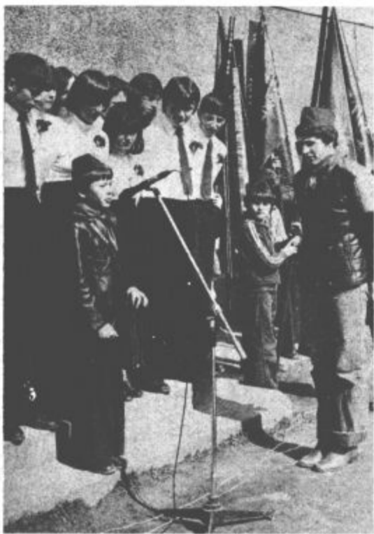
V malem mestecu Vitanje pri Slovenskih Konjicah se je v petek dopoldne zbrala množica ljudi. Na trgu pred kulturnim domom so namreč kurirji pionirskega odreda 14. divizije iz Vitanja predajali kurirčkovo pošto pionirjem iz naše občine.