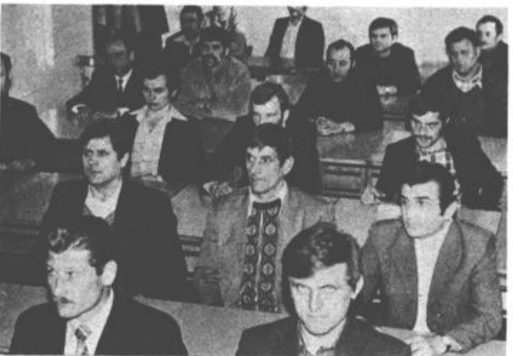
Udeleženci politične šole

KPJ in ZKJ, Idejna vloga in idejni boj komunistov ter Organiziranost in metode dela ZK. Ob zaključku predavanja posamezne skupine imajo slušatelji še poseben pogovor s sekretarji OO ZK, predstavniki komiteja konference organizacije ZK Rek in predavatelj šole.