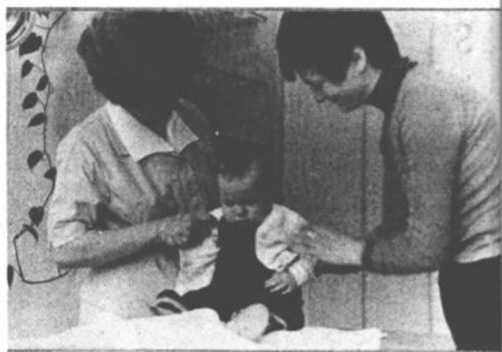
O koristnosti cepljenja res ne more biti dvoma