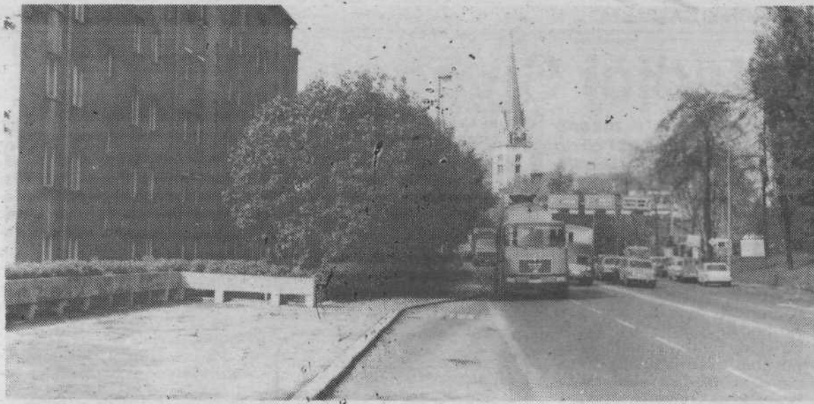
Skozi KS Prule je speljana v Ljubljano vpadnica z dolenske smeri