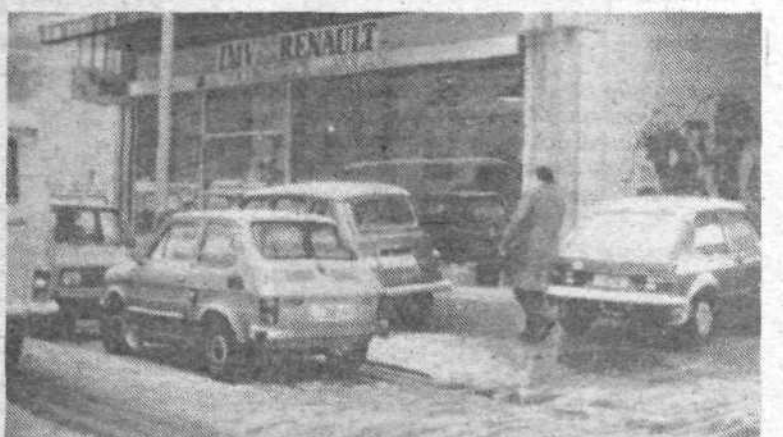
Vsakodnevna podoba središča mesta. Pešci se morajo izogibati vozilom celo na pločnikih in prehodih.