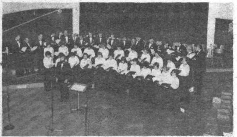
Pevski zbor Glasbene matice med enim od številnih nastopov