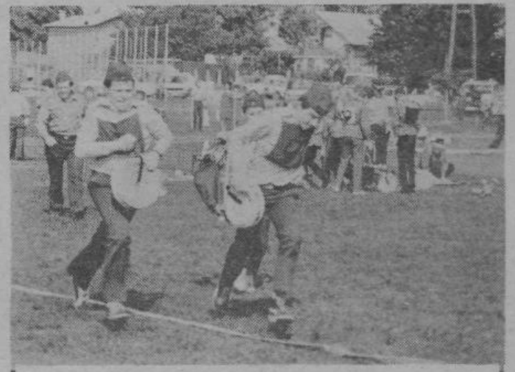
Sredi prejšnjega meseca je bilo v športnem parku na Vevčah republiško tekmovanje selekcij mladih gasilcev SR Slovenije. Udeležilo se ga je več kot 2000 mladih tekmovalcev.