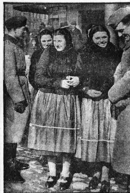
Nemški vojaki v razgovoru s sramežljivimi češkimi podeželskimi dekleti.

Gospa: »Kje pa so vaša spričevala?« Nova služkinja: »Doma sem jih pozabila, jih pa drugič prinesem. Ampak povem vam, da sem povsod točno vršila svoje dolžnosti. V zadnji službi sem vseljala že ob petih, skuhala zajtrk, vse sobe in vse postelje pospravila, še preden je kdo vstal.«