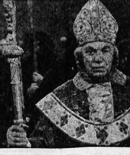
... Spredaj je šel škof, za njim pa Rihard in Robin Hood...

Zazdelo se mu je, da škof z Black Cannona epet hodi mnogo prepočasi, da preveč lagodno dviguje noge — prav kakor bi to delal namenoma, da bi morda še utegnil dobiti kakšno priliko za rešitev.